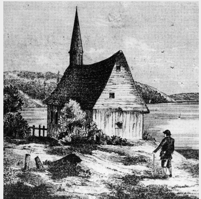
Chapelle du poste de traite de Chicoutimi.

À la suite de la commercialisation du Domaine-du-Roy (territoire que se réserve le roi, s'étendant sur des centaines de kilomètres carrés le long de la rivière Saguenay, de l'île aux Coudres jusqu'à Sept-Îles) par la traite de Tadoussac en 1652, des commerçants construisent une maison à l'embouchure de la rivière Chicoutimi dans le but d'en faire un poste de traite en 1671. Cinq ans plus tard, cet établissement devient officiellement le chef-lieu du commerce des fourrures dans le Domaine-du-Roy. Une chapelle sous le patronage de saint François Xavier est aménagée près du poste. Alimenté par les villages amérindiens du lac Kénogami, le poste de Chicoutimi produit en 1684, à lui seul, plus de pelleteries que tout le reste du Canada réuni.