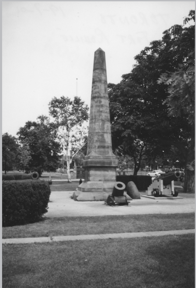
Obélisque situé sur l'immense terrain de l'Exposition Nationale Canadienne (CNE), près de la coquille métallique abritant le théâtre musical extérieur et du grand mât de 50 mètres de haut, et rappelant le site du fort Rouillé, devenu Toronto.

Précisons qu'en fait (pourvu qu'on cherche beaucoup), on trouvera des témoins de cette présence française à au moins trois endroits : une vitrine à l'intérieur du fort York, au block-