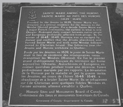
Plaque bilingue résumant l'histoire du lieu.

Dans cette métropole de 3 à 4 millions d'habitants, qui se veut absolument multiculturelle, au moins 10 % des gens sont d'origine française, mais plusieurs d'entre eux ne parlent plus le français. Une famille qui veut vivre en français trouvera des écoles, des postes de radio et de télévision et un certain nombre d'institutions culturelles répondant à ses besoins. Toronto a ravi à Montréal son titre de métropole... mais elle n'a pu lui enlever sa vie culturelle!