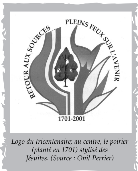
Logo du tricentenaire; au centre, le poirier (planté en 1701) stylisé des Jésuites.

Non loin de Windsor, sont situés la Pointe Pelée (devenue parc fédéral) et l'Île Pelée, le territoire le plus méridional du Canada. Le chevalier de Tonti est passé par là en 1678 et il y aurait ouvert un petit poste de traite.