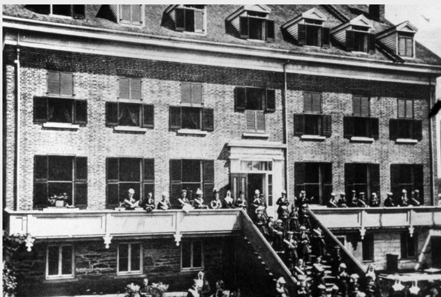
Étudiantes et religieuses de la congrégation Notre-Dame devant le premier couvent du Mont Notre-Dame en mai 1857.

Avant d'être un diocèse indépendant, le territoire de l'Estrie relevait à la fois de Saint-Hyacinthe et de Trois-Rivières. De Saint-Hyacinthe viendront les Sœurs de la Présentation de Marie, qui iront à Coaticook, où elles ont toujours un très beau pensionnat (Marie-Rivier); de Trois-Rivières, les Sœurs de l'Assomption de la Sainte-Vierge suivent le mouvement de colonisation à Wotton et