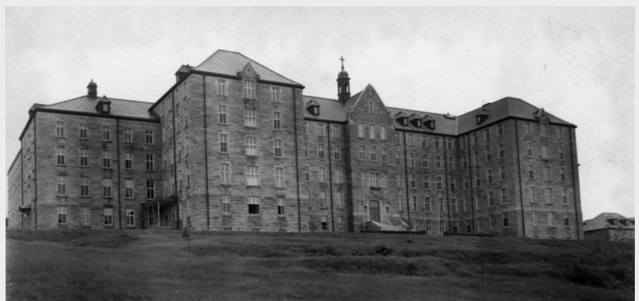
Mont-Sainte-Famille : maison générale des Petites Sœurs de la Sainte-Famille, Sherbrooke, vers 1957, maison qu'on aperçoit du pont Jacques-Cartier.

Diverses congrégations d'hommes, de religieux-prêtres en particulier, sont accueillies par M gr LaRocque. Mentionnons les Rédemptoristes, qui développeront à Sherbrooke le culte de Notre-Dame du Perpétuel-Secours et qui ouvriront en 1923 la première maison de retraites fermées, la villa Saint-Alphonse. Au même moment, en 1922, les Franciscains inaugurent un noviciat à Lennoxville. C'est là que s'implantera en 1996 la famille Marie-Jeunesse, dont nous aurons l'occasion de reparler.