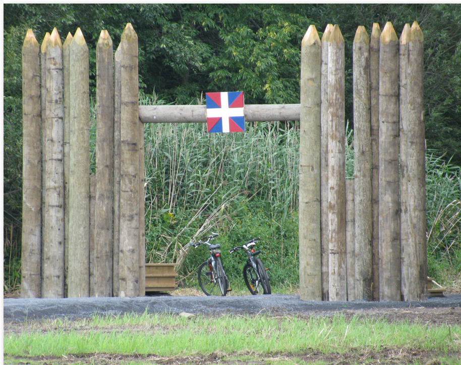
Portail commémoratif érigé en 2015 à l'entrée des vestiges du fort Sainte-Thérèse. Certains éléments rappellent les caractéristiques de ce fort : double palissade, meurtrières, banquette de tir.