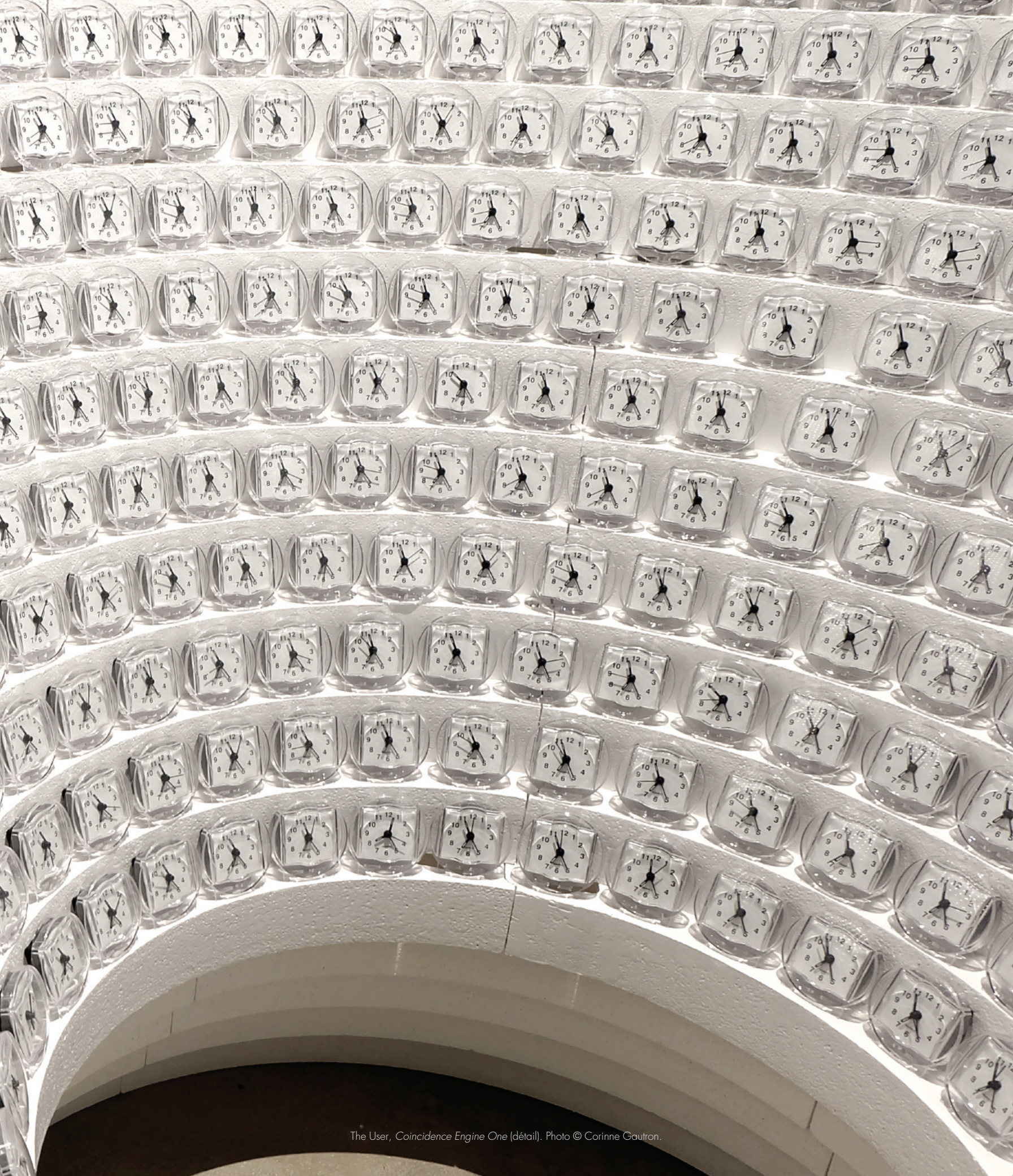
The User, Coincidence Engine One (détail).