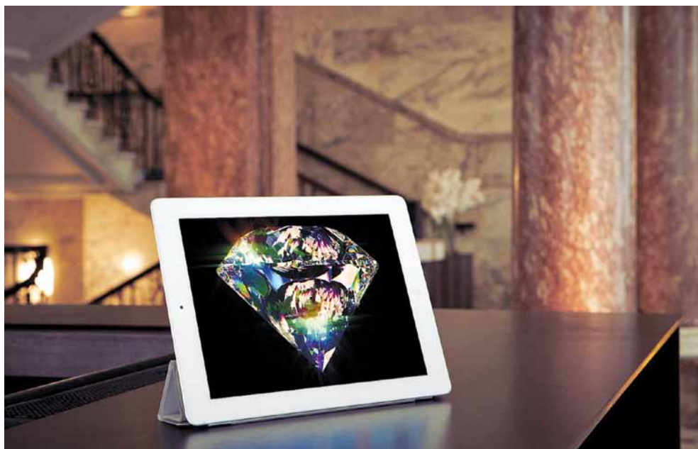
Mat Collishaw, Prosopopeia.