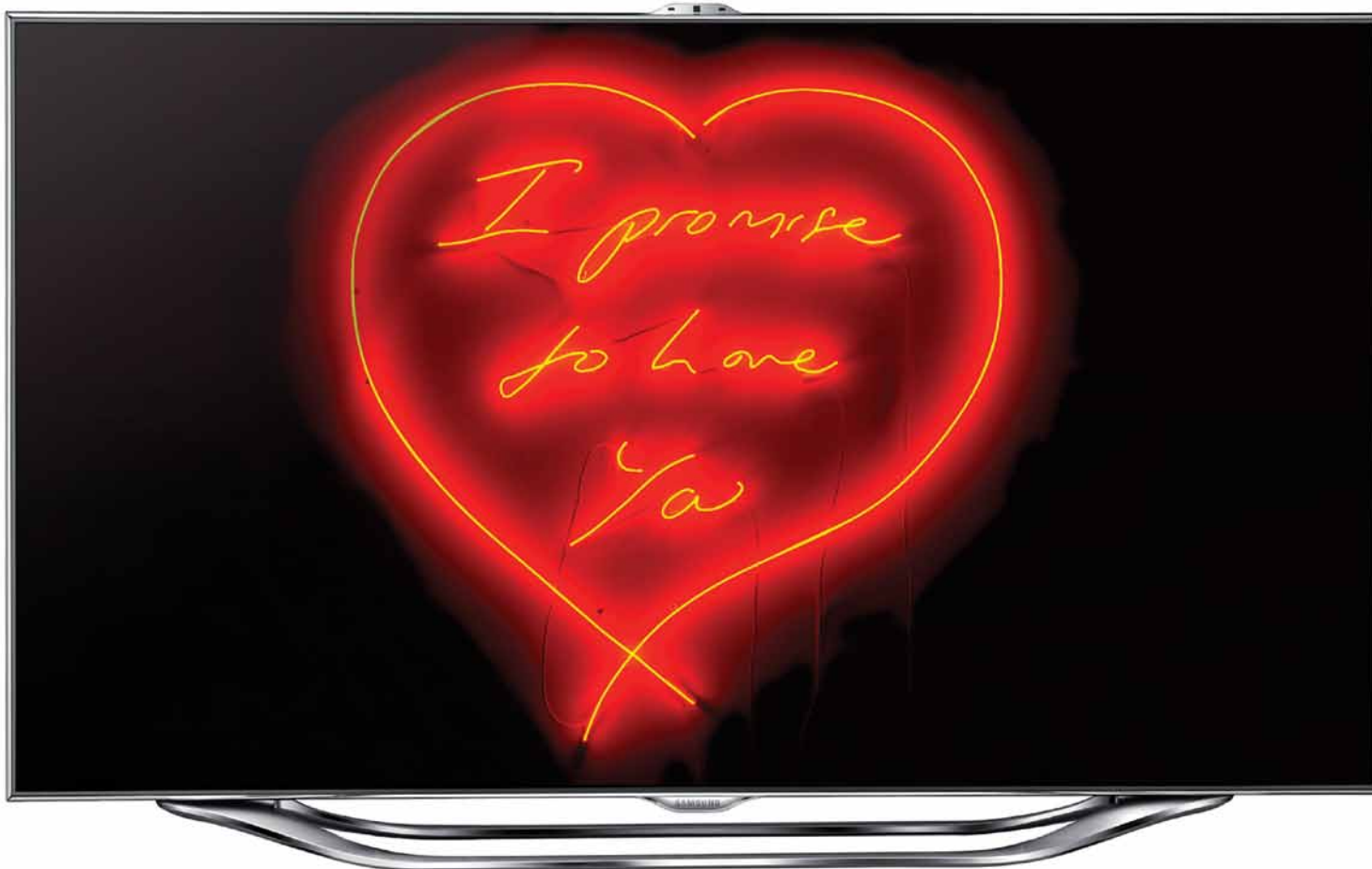
Tracey Emin, I Promise To Love You , displayed on TV.

littérature, votre art... » Et une façon de le faire est de les encourager en les payant pour leurs œuvres. Évidemment, lorsqu'il est question des artistes les plus célèbres sur la scène internationale, seuls quelques très riches collectionneurs pouvaient jusqu'à maintenant se permettre de le faire. Par conséquent, notre objectif est d'élargir ce contexte et de l'ouvrir à un plus large public. Les artistes avec lesquels nous travaillons aiment ce modèle parce qu'il leur permet de rendre leur travail plus accessible. Simultanément, ce modèle permet au public de s'engager dans des discussions sur l'art contemporain comme jamais auparavant.