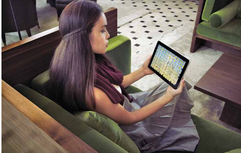
Casey Reas, 100% Gray Coverage. © Sédition.

Oui, c'est vrai, la possession d'un artefact numérique est une idée un peu bizarre. Ce que nous faisons est de vous permettre de télécharger l'œuvre dans l'application et d'obtenir un numéro de certificat numérique, qui vous indique quelle œuvre vous avez en votre possession. Mais les collectionneurs savent qu'ils possèdent vraiment une œuvre lorsqu'ils peuvent la vendre à leur tour. En possédant l'œuvre sous forme numérique, ils peuvent réaliser un gain ou subir une perte, tout comme les choses se passent dans le monde réel. Personnellement, je n'aime pas l'idée de la marchandisation de l'art. L'art lui-même est le vrai but de Sédition, mais il faut admettre que la possibilité de revendre les œuvres a contribué à rassurer un grand nombre de ceux qui collectionnent ces éditions numériques. Depuis que nous avons ouvert la section « commerce », Ryoji Ikeda est une vedette du marché secondaire avec l'édition numérique