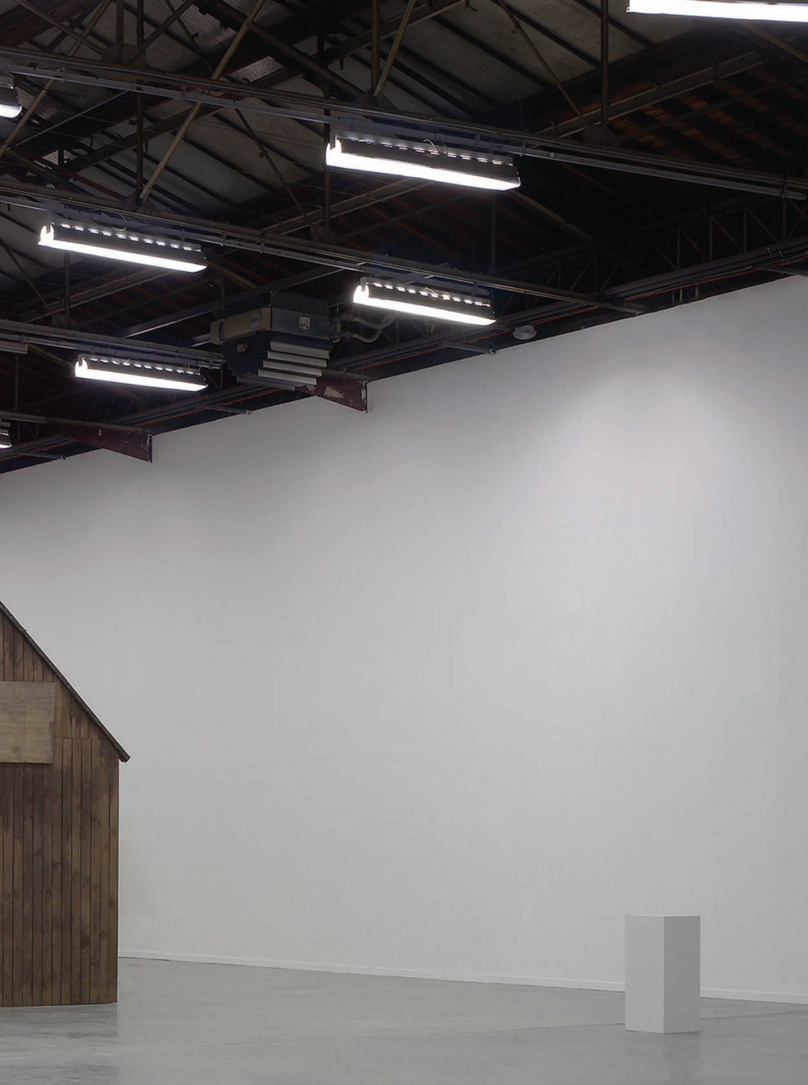
De gauche à droite : Robert Kusmirowski, Unacabine , 2008. Planches de bois, papier goudronné, bois contreplaqué, tuyau en étain, huile, acrylique ; 398 x 322 x 355 cm. Courtoisie de l'artiste et Foksal Gallery Foundation, Varsovie.