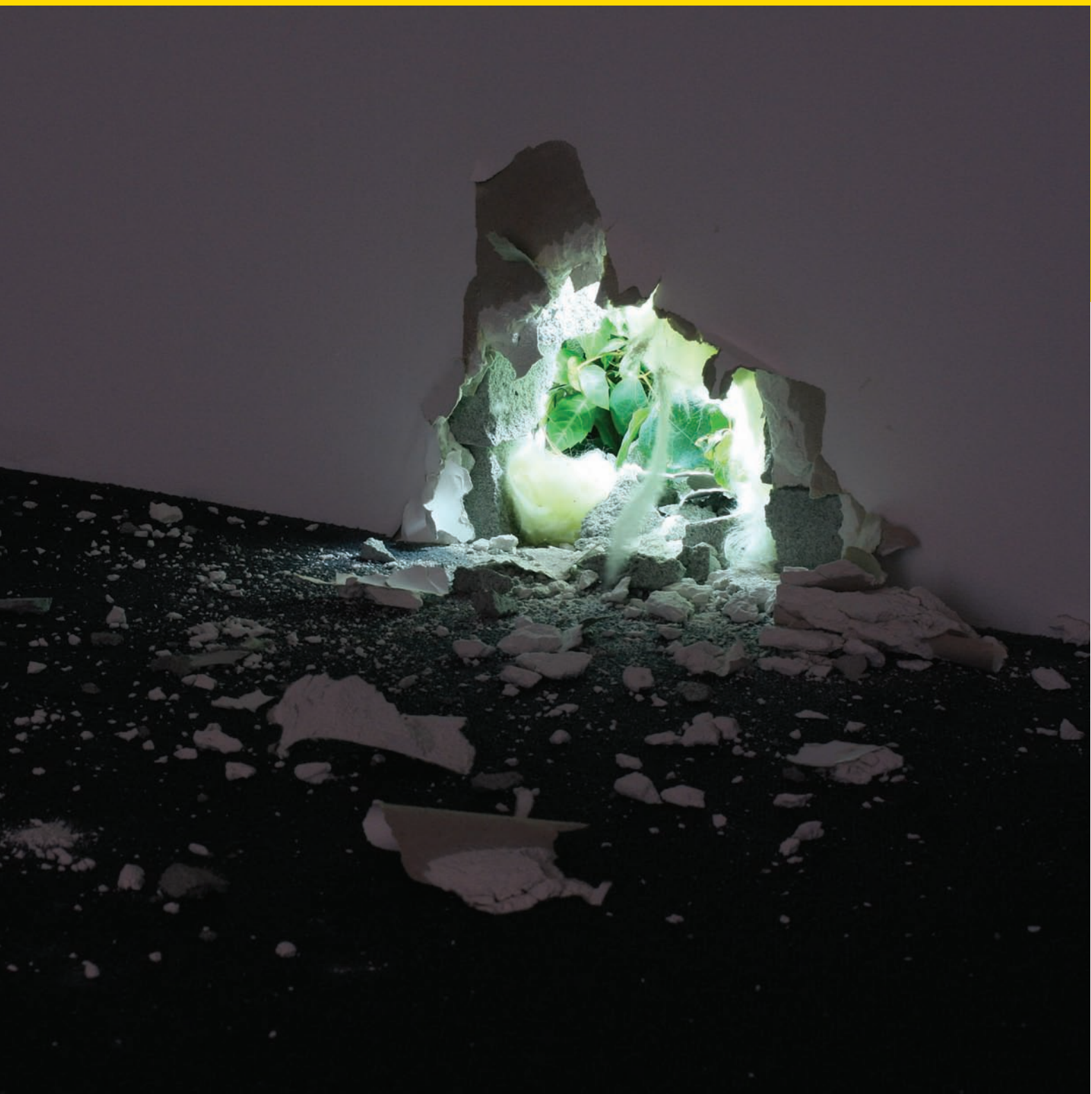
Ryan Gander, /Nathaniel Knows/ , 2009. Vue de l'installation au Daiwa Press Viewing Room « More than the weight of your shadow », Daiwa Press Co., Ltd. Photo de Mami Iwasaki © Ryan Gander, 2007. Courtoisie de TARO NASU.

autres sans dialoguer entre elles, elles renvoient au-delà de leur sens propre à une image décalée du réel.