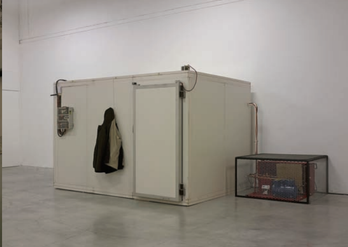
Micol Assaël, Vorkuta , 2001. Cellule frigorifique (-30°C), tableau électrique, étincelles, chaise équipée d'une résistance électrique, thermostat (37°C) ; 210 x 220 x 350 cm. Collection Sandra & Carlo Bonollo, Italie. Courtoisie Galleria Zero, Milan. Vues de l'exposition Chasing Napoleon , 2009, Palais de Tokyo. Photographies : André Morin.

Charlotte Posenenske, Vierkanthre Serie D , 1967-2009. Tôle d'acier galvanisé ; Dimensions variables. Reconstitution autorisée par certificat. Estate Charlotte Posenenske, Francfort. Courtoisie Galerie Mehdi Chouakri, Berlin. Vue de l'exposition Chasing Napoleon , 2009, Palais de Tokyo. Photo : André Morin.