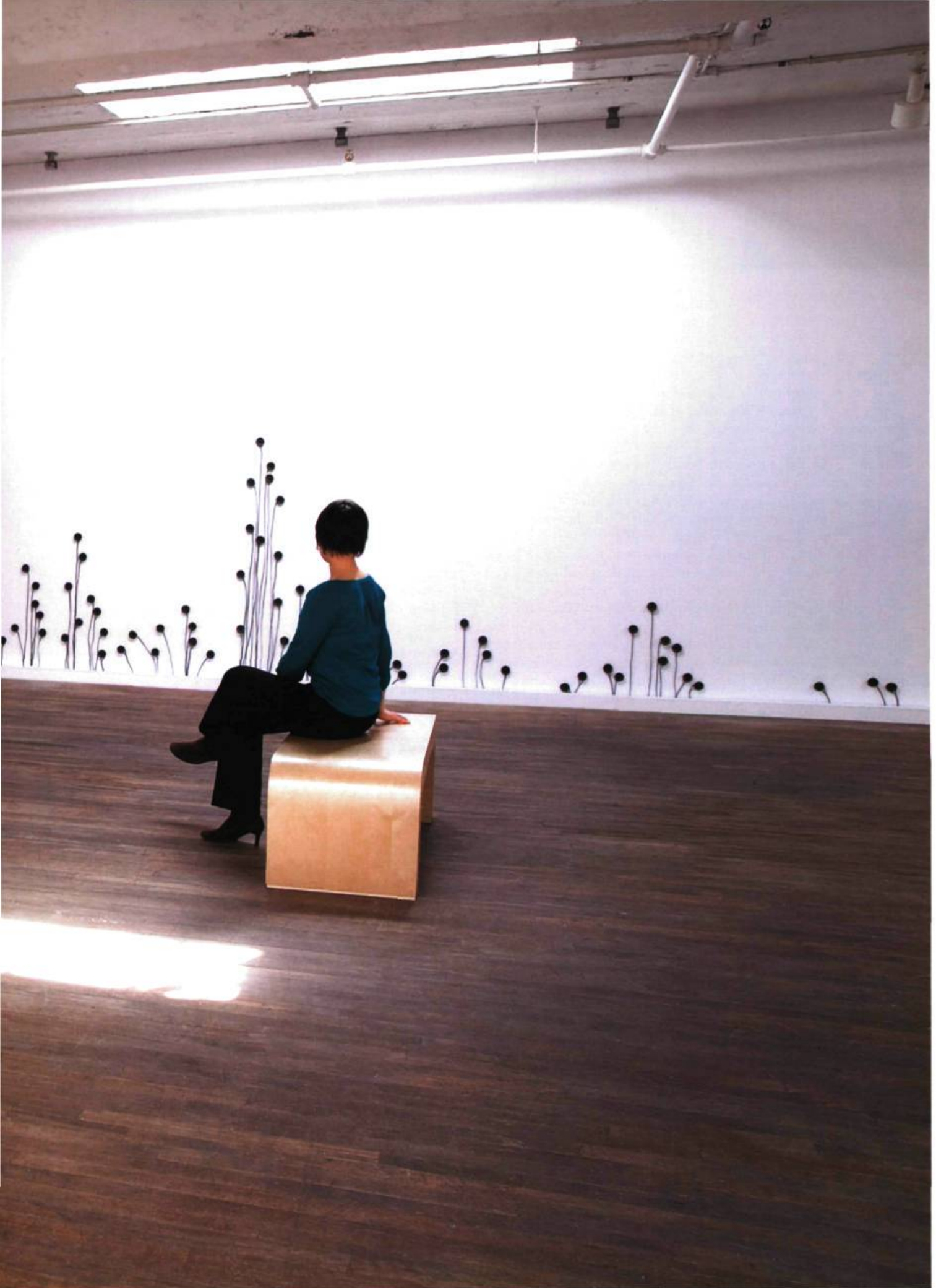
Robin Minard, Silent Music , 2006. Exposition Sons sur papier , 2008. Hauts-parleurs piezo, 4 canaux audio.