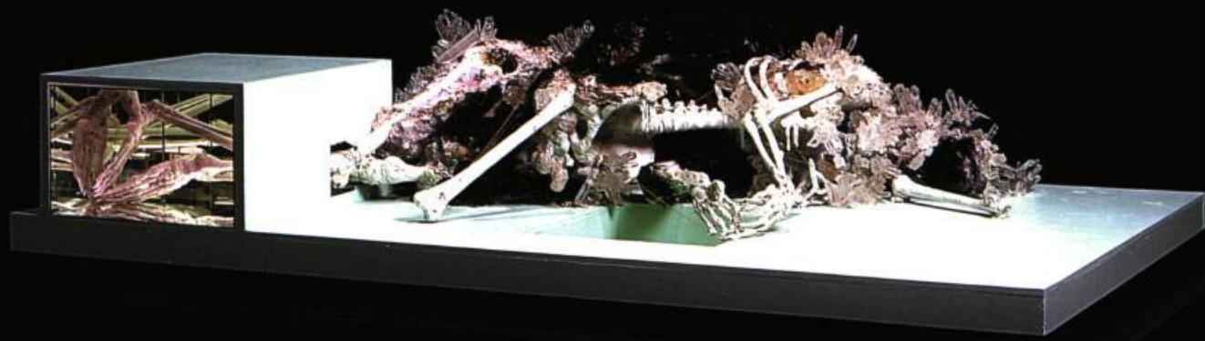
David Allmejd, The Lovers , 2004. Bois, peinture, Plexiglas, miroir, système d'éclairage, plâtre, résine, polystyrène expansé, cheveux synthétiques, bijoux, fil de fer, chaîne, brillants; 114 x 229 x 137 cm.