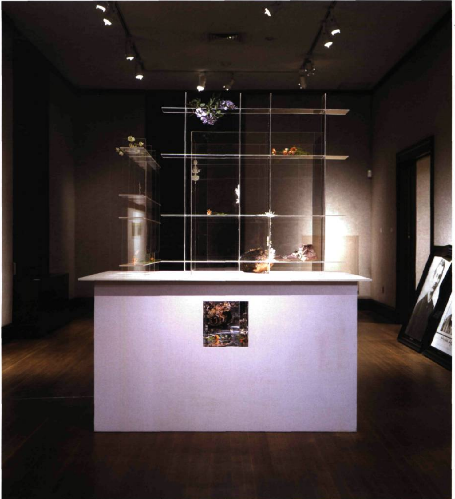
David Altmejd, Loup-Garou 2 , 2000. Bois, peinture, Plexiglas, miroir, système d'éclairage, plâtre, pâte à modeler, polymère, cheveux synthétiques, acetate, mylar, brillants, 243,8 x 182,9 x 213,4 cm.