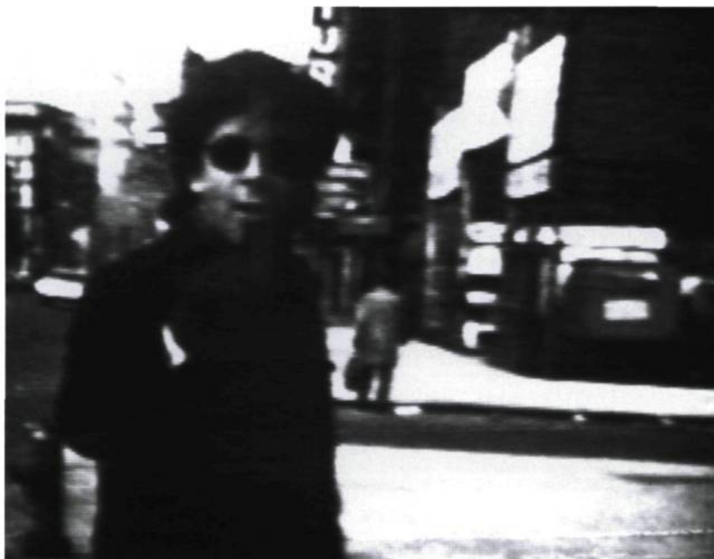
Les Levine, I am an artist , 1975.