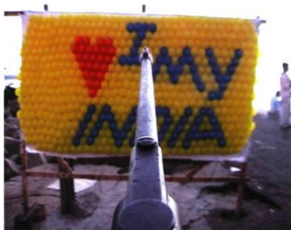
Tejal Shah, I love my India , 2003. Vidéo; 10 mn.

Féministe corrosive dans sa vidéo pseudo sadomasochiste, Tejal Shah vise, de façon plus sensible, la réception des médias en Inde, invitant des chalands à tirer sur des ballons rouges et jaunes formant les