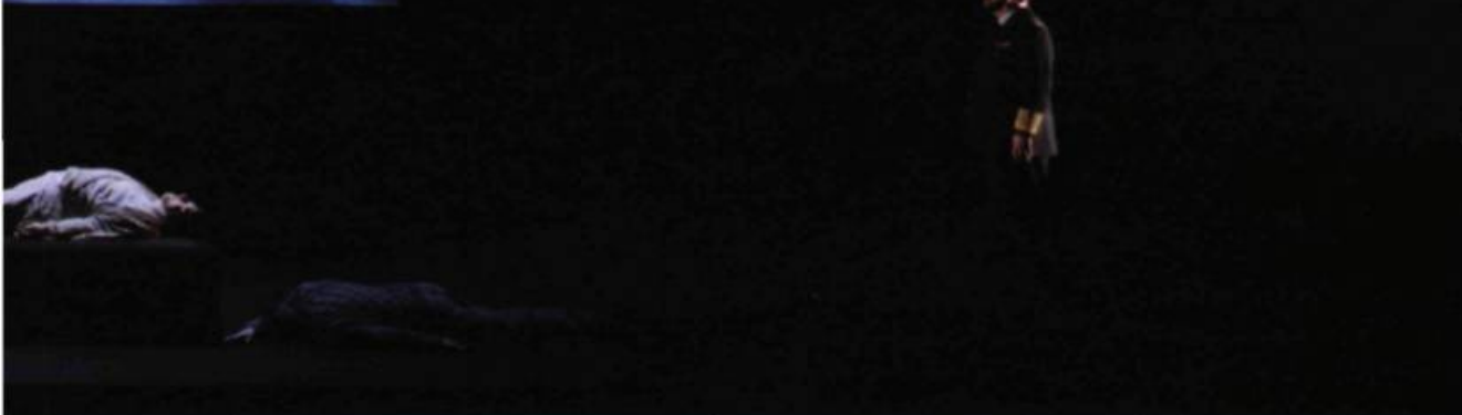
Tristan & Isolde (Wagner), par Peter Sellars, vidéo de Bill Viola dans le cadre de la mise en scène de l'Opéra National de Paris, Bastille, 2005.

la musique et la certitude matérielle de la peinture, et sont donc particulièrement adaptées à la création d'un lien entre les éléments pratiques de la conception scénique et la dynamique de la représentation 4 . Le couple de personnages vidéo déroule ainsi une version symbolique, ralentie, muette de l'action chantée, concentrée en une action (marche, plongée, allumage de bougie, immersion) qui prend des allu-