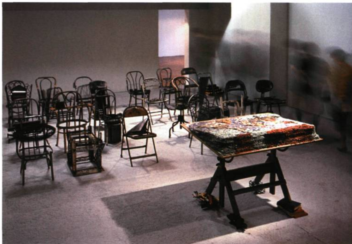
Michel Goulet, Assemblée , 1987. Acier, chaises, table, cassette et objets; 127 x 700 x 700 cm. Don de Norman, Laurel et Kristian Laliberté, coll. du Musée national des beaux-arts du Québec.