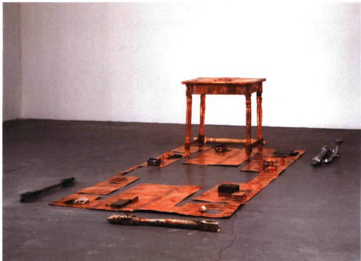
Michel Goulet, Autour/Atours , 1983. Cuivre, bois, acier galvanisé, aluminium et objets divers; 69 x 183 x 274 cm. Coll. Musée d'art contemporain de Montréal.

niveau conceptuel que se trouve sa force principale. Dans Autour/Atours , la table sert d'élément de départ pour l'élaboration d'une suite sémiologique : il y a une patte moulée et son moule, qui marquent la suite syntagmatique, et potentiellement infinie, du même; les différents éléments retrouvés dans cette scène – car il en est question ici –, font tous partie du même paradigme. Par exemple, nous retrouvons un étalement des outils d'un atelier de création, qui représentent, sous la forme d'une suite analytique, les objets du quotidien d'un artiste; nous retrouvons tous les éléments relatifs au signifiant « table », ici utilisé comme le symbole de l'univers de l'artiste. L'œuvre de Goulet constitue donc un lieu dans un lieu. La relation à l'espace est structurelle. La disposition des objets aussi corrobore cette conclusion. Les objets sont disposés dans un syntagme logique, horizontal, refusant les « critères traditionnels » de la sculpture, en ce sens qu'il ne s'agit pas d'un objet monolithique . Les objets se côtoient comme des miroirs d'eux-mêmes, la patte et son moule, le moule et son moulé, etc. Il s'agit d'une scène de crime, où tous les éléments servant au crime sont offerts à l'œil de l'investigateur. Ainsi va son comportement analytique.