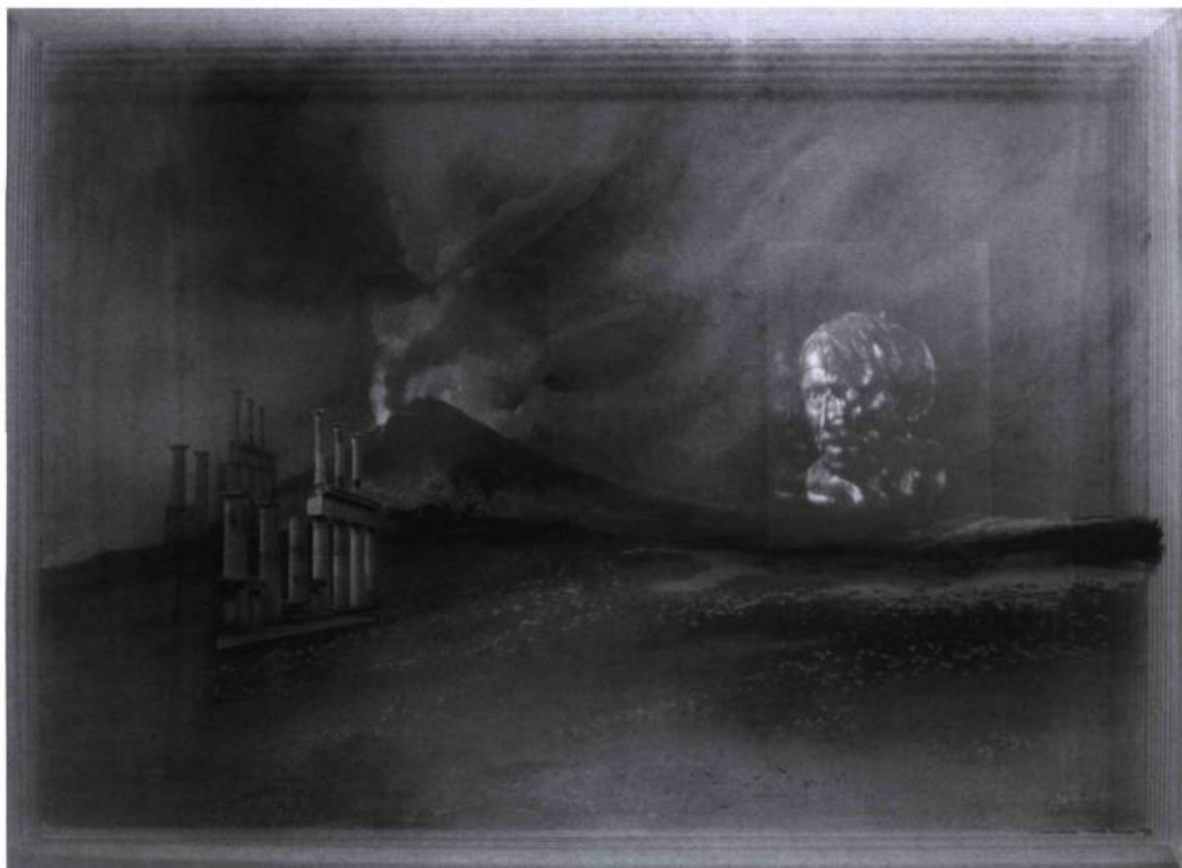
Carole Brisson, Imminence , 1998. Matériaux mixtes; 105, 5 x 76 cm. Collection de l'artiste.

santes plastiques. Ainsi, elle induit volontairement une dialectique, dont les thèses et antithèses s'articulent selon les pôles inactuel-actuel, révolu-permanent, traditionnel-technologique et matériel-spirituel. En ce sens, elle suit, à travers son inspiration, un parcours déjà tracé vers la concrétisation d'une expérience qu'elle adapte sans cesse.