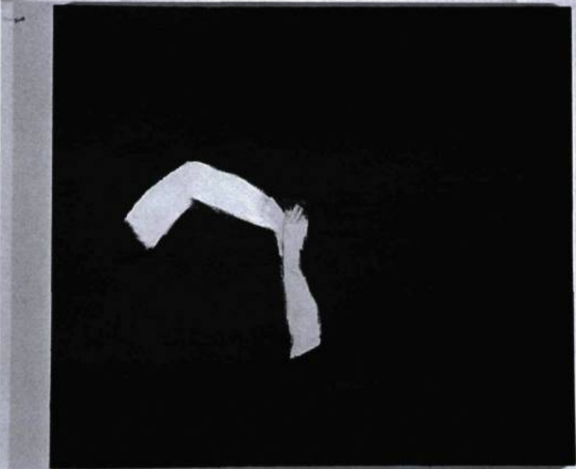
Louise Masson, Scène d'amour IX , 2002. 87 x 112 cm. Galerie Trois Points, Montréal.