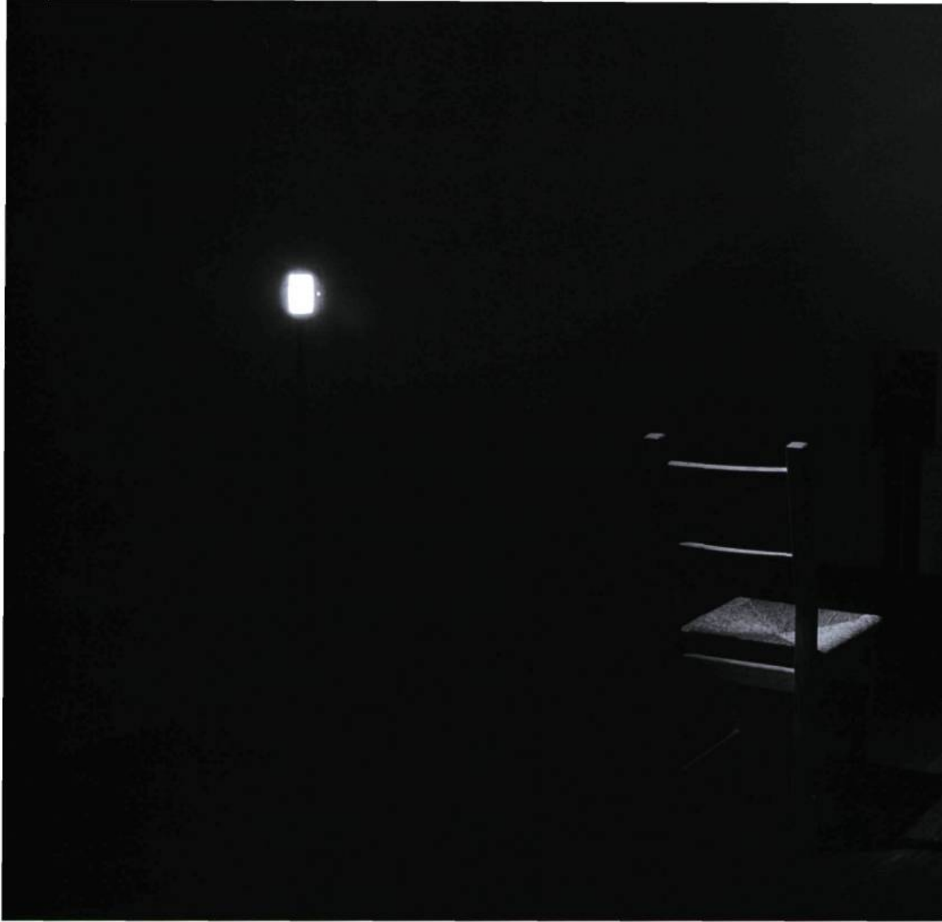
Jacelyn Robert, Quelques fragments dans la mémoire de Catherine , 2002. Oboro, Montréal.

de son mouvement. Ombres et temps sont les matières brutes, reprises de cette œuvre.