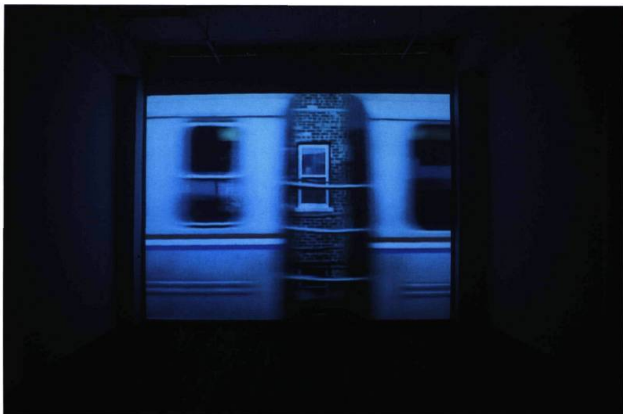
Jocelyn Robert, Catarina , 2002. Oboro, Montréal.