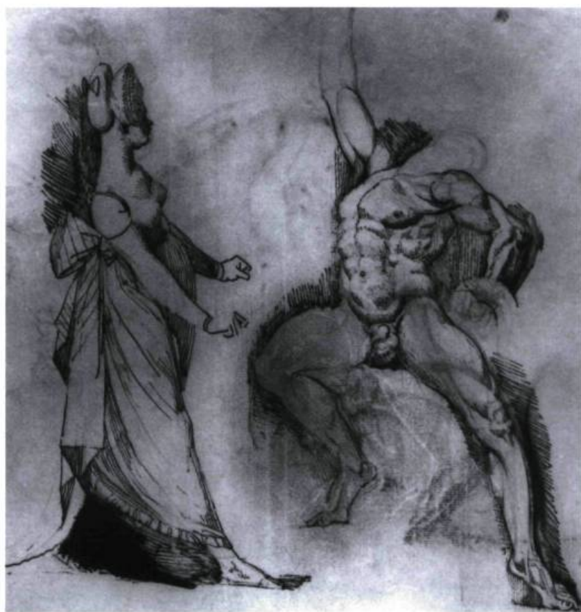
J. H. Füssli, Femme devant le Laccoon , 1801-05.

D'autres médiums qui pourtant pourraient eux aussi permettre une plus grande diffusion des images semblent avoir eux aussi été limités dans leurs usages. Dans le milieu des arts, les tirages photos se font de plus en plus en quantités limitées. Ce fut une révolution récemment lorsqu'une compagnie a réussi à convaincre des photographes de vendre en plus grand nombre (et moins cher donc) certaines de leurs images. Même la vidéo et le cinéma semblent être extrêmement contrôlés de nos jours. Matthew Barney, par exemple, présente au compte-goutte son cycle des Cremaster dans certaines villes et pour une période très limitée.