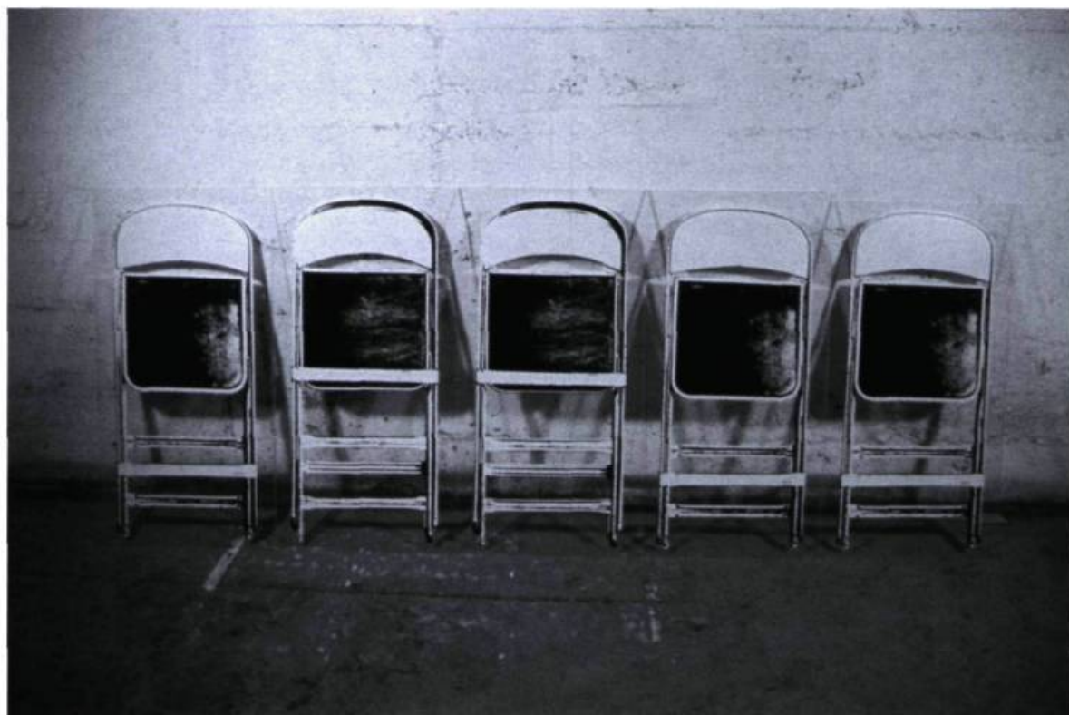
Pierre Ayot, Pile et face , 1974. Sérigraphie sur plexiglas, 8 éléments de plexiglas et une chaise. Coll. Madeleine Forcier. © Succession P. Ayot/Sodart 2001.

la fois sculpturaux et domestiques (pouf, chaise, table...). Ces divers débordements indiquent assez combien l'artiste était à l'étroit dans un genre fixe et surtout, comment il conjugait l'art et la vie sur tous les modes, les contaminant l'un par l'autre ou disons plutôt, pour rester plus près de l'esprit de son œuvre : les rehaussant, les faisant valoir l'un par l'autre.