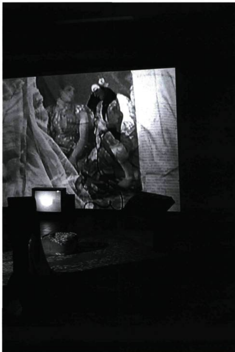
Christine Palmiéri, Néant Compulsif II , 2000. Installation-vidéo (détail).