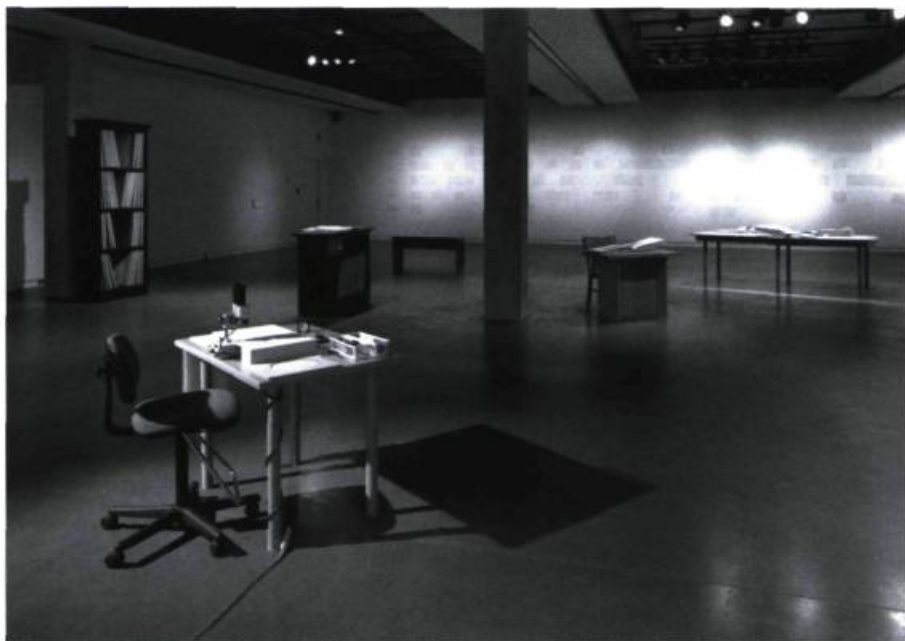
L'arène des livres , 2000. Vue partielle de l'exposition.

L'arène des livres , Raphaëlle de Groot, Fred McSherry, Vincent Bonin, commissaire : Florence Chantoury, Centre d'exposition de l'Université de Montréal, Montréal. 16 mars-13 avril 2000