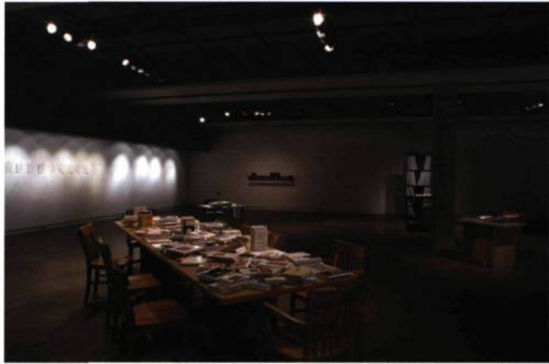
L'arène des livres , 2000. Vue partielle de l'exposition.