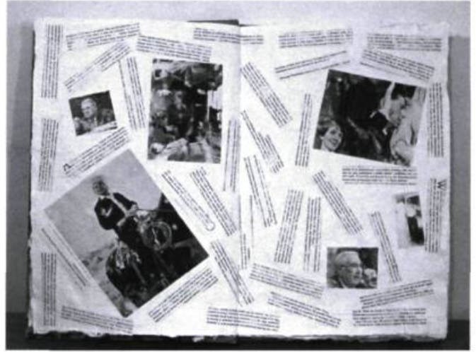
Fred McSherry, The Virtual Library, President Reagan & The Evil Empire , 1995. 22 pages, papier fait à la main, couverture de toile et cuir, titre à la feuille d'or; 46, 2 x 31 x 3 cm. (Détail).