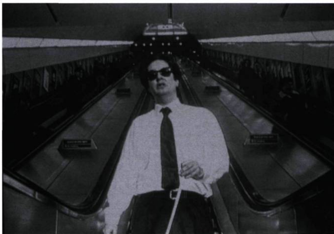
Mark Wallinger, Angel , 1997. Vidéogramme, 7' 30". Édition de 10 + 2 AP. © Mark Wallinger. Courtoisie: Anthony Reynolds Gallery, Londres.

Biennale de Montréal '98, Centre international d'art contemporain de Montréal, Montréal. Du 27 août au 18 octobre 1998