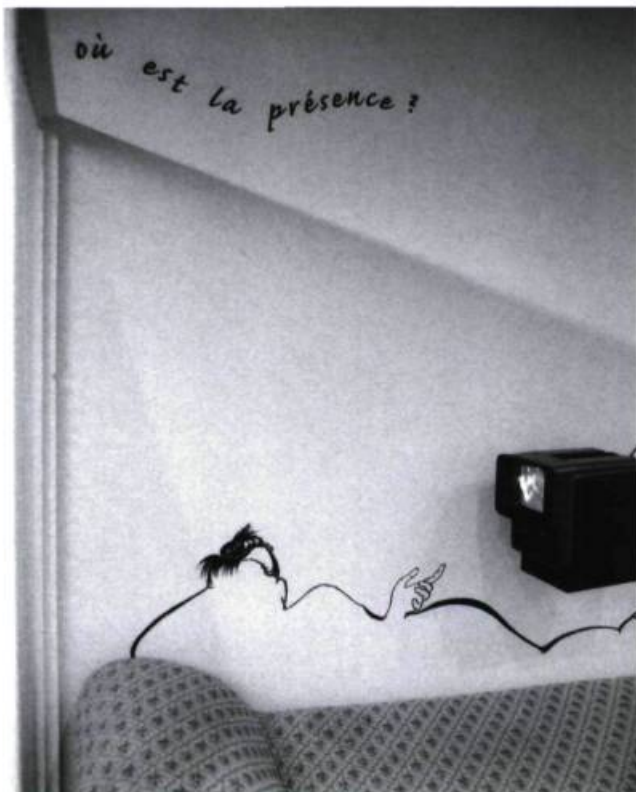
Sylvie Tourangeau, Mais... où est la présence ? , 1990. Objets, silhouette peinte, extrait de la vidéo-témoign de la performance La vie est un Bip de 1990.

Sylvie Tourangeau, Objet(s) de présence , Musée d'art de Joliette. Du 3 mai au 16 août 1998