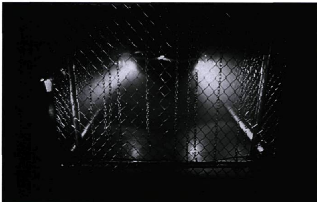
Louis-Philippe Demers & Bill Vorn, La cour des Miracles , 1997.

mande à être comprise et analysée dans sa totalité. Hors de cet environnement, les robots ne sont plus que de luxueux gadgets, les éléments architecturaux, des éléments de décors quelconques. La création de cet habitat pour robots est le résultat d'une habile mise en commun d'éléments sonores, lumineux et architecturaux. Tout d'abord, les immenses structures métalliques et le grillage évoquent directement l'univers industriel ou carcéral; l'impression d'immersion dans l'œuvre est créée également par une juxtaposition d'éléments sonores et lumineux qui sont les composantes charnières de l'environnement. Immatérielles, ces dernières créent une spatialité englobante qui ancre le spectateur dans un univers qui semble autant réel qu'irréel. Pénétrer dans La cour... équivaut à être instantanément transporté ailleurs : le caractère immersif de l'œuvre déplace le spectateur bien loin du musée.