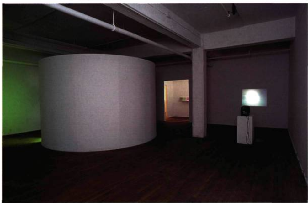
Claire Savoie, Une date, le nom d'un lieu et l'heure du rendez-vous , 1998.

convenir, l'absence est souvent plus lourde à ressentir que la présence, rassurante.