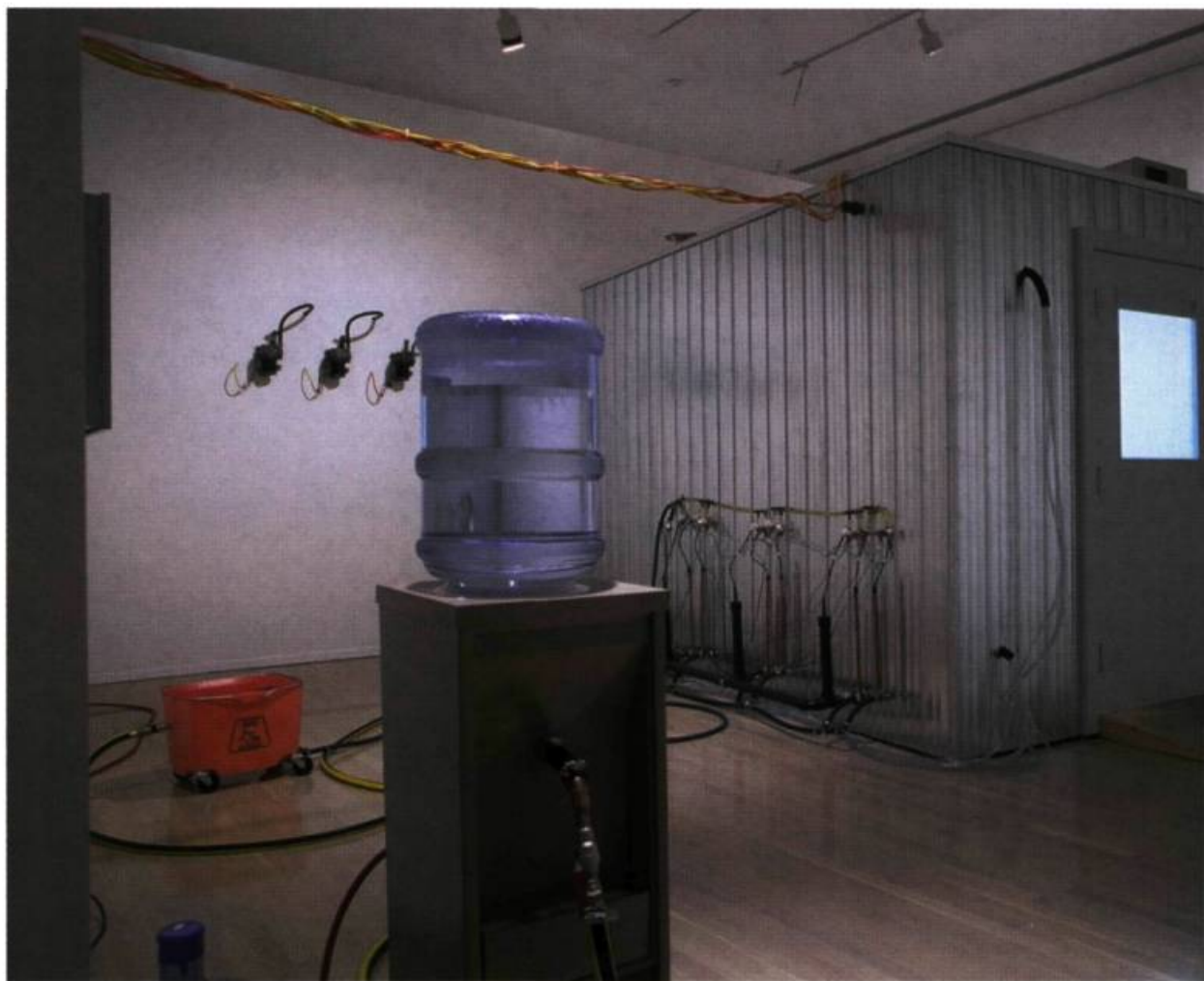
Jean-Pierre Gauthier, La salle d'eau # 2 , 1997. Installation sonore: les divers systèmes (électrique, pneumatique, hydraulique) en périphérie de la cabane convergeaient à l'intérieur de celle-ci afin de l'animer par un système sonore bruitiste. Durée du cycle de 7 min. Distributeur d'eau, compresseurs, relais, valves, tôle galvanisée, appau, sifflet, train, flûte alto; 4 x 8 x 8 m.

L e débat porte sur la réunion de l'esthétique et de la science. Pour le comité de rédaction, il s'agit d'aborder la question en regard des productions artistiques, qu'elles soient pratiques ou théoriques. Bien entendu, nous n'avons pas la prétention de mettre à jour un nouveau phénomène mais plutôt de réfléchir sur le développement de cette union dont le contexte semble favoriser l'émergence de nouveaux objets artistiques. Nos discussions ont tourné autour des problématiques suivantes : les connivences entre l'histoire de l'art, les productions artistiques et la science; la science développe un