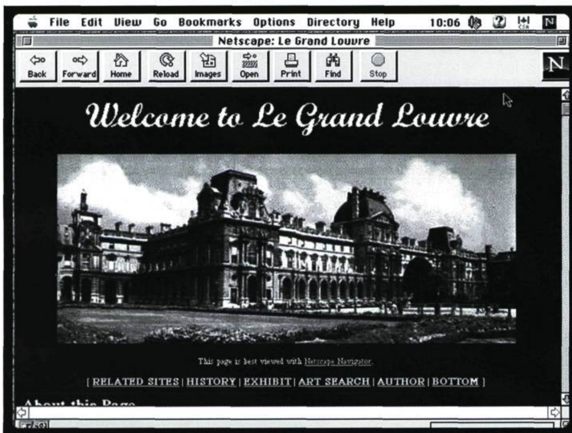
Le Grand Louvre sur Internet

maîtrise du développement culturel dans les espaces nationaux n'est qu'un discours de désarmement de la pensée, de désappropriation par les peuples et les nations de leur culture, de leur identité, de leur imaginaire, de leurs possibilités d'accéder au développement culturel et au statut de citoyen-monde légitime dont la contribution est nécessaire au devenir mondial. Tous les lecteurs auront bien sûr compris qu'il s'agit là d'une situation souhaitable, mais dont l'actualisation est pour le moins problématique, compte tenu de l'inégalité des pouvoirs qui structure actuellement les rapports internationaux, non seulement entre les peuples, nations et régions du monde, mais aussi entre les individus, selon leur provenance. La prise de conscience de cette inégalité et de l'illégitimité sociohistorique de cette situation pourrait constituer, il faut l'espérer, un premier pas vers la redéfinition des rapports arts-monde dont nous avons parlé plus haut.