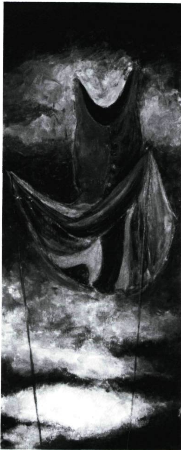
Sophie Lanctôt, Mouillé , 1995. Tempera sur bois; 37 x 15 cm.

n'importe quel retour ! L'art le plus bas dans la hiérarchie des genres nous dit sa marginalité et la limite du pouvoir des genres nobles. La marge est toujours le lieu où la norme risque de se court-circuiter.