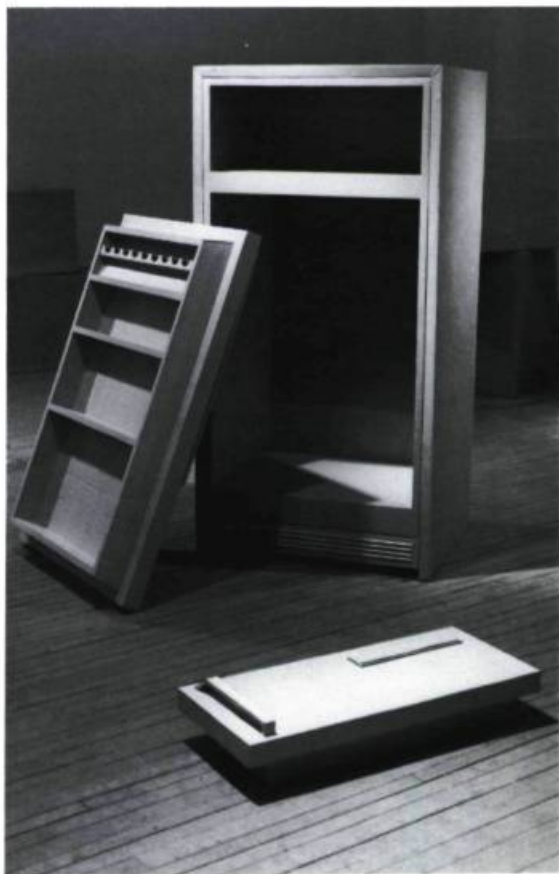
James Carl, Sans titre, 1992. Carton.

La matière perd son statut de constante en devenant un objet d'art. Tout au long de l'exposition, les objets se retrouvent à la cueillette des ordures. La matière revient donc à son lieu d'origine sous une satire tragi-comique du quotidien. L'œuvre d'art donne du sens tandis que l'objet usuel n'en donne aucun. La matière trouvée, détournée de son contexte, possède, tout à coup, un contenu à reconstruire pour le spectateur. L'artiste dérègle les échelles de valeurs de nos sociétés de consommation et de consommation de l'art.