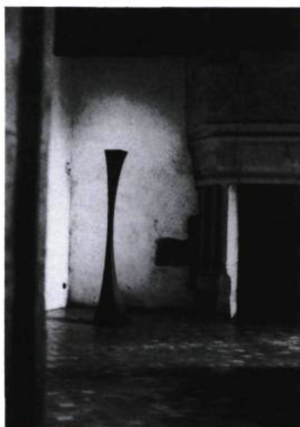
Jocelyne Allouche, Solstice (détail) , 1992. Photographies noir et blanc, bois laqué, verre teinté, clair et dépoli, graphite et plomb ; 224 x 620 x 930 cm. Collection de l'artiste.