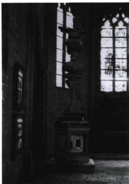
Pierre Ayot, Les grandes aventures de Benvenuto Cellini , 1989. Techniques mixtes sur bois ; 518 x 152 x 152 cm. Collection de l'artiste.