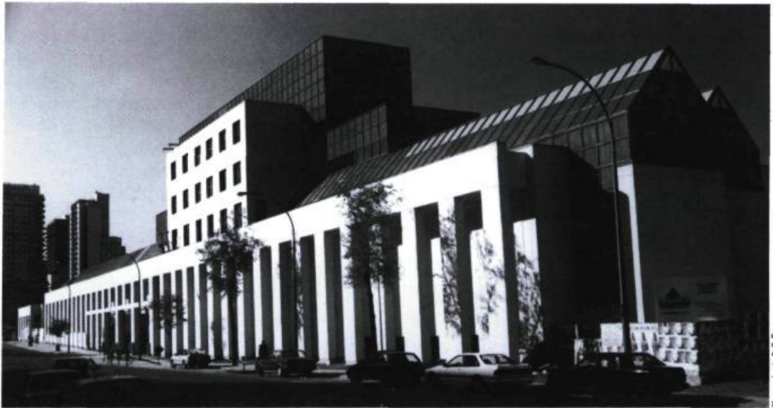
Le nouvel édifice du Musée d'art contemporain de Montréal.

ASSOCIÉ DE LA FIRME JODOIN, LAMARRE ET PRATTE