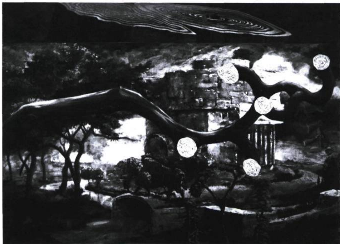
Michel Boulanger, Le culte de la planéité , 1990 ; 170 cm x 230 cm.

entre les structures constitutives de l'existence matérielle et existentielle. « On peut supposer aussi une sorte d'effort immense que fournit la volonté pour produire du sens et gérer l'absurde en toute cohérence. » La contradiction, la mise en doute de l'indicible et du visible ainsi que la confrontation entre la vie et la mort sont parties intégrantes d'une réalité ambivalente.