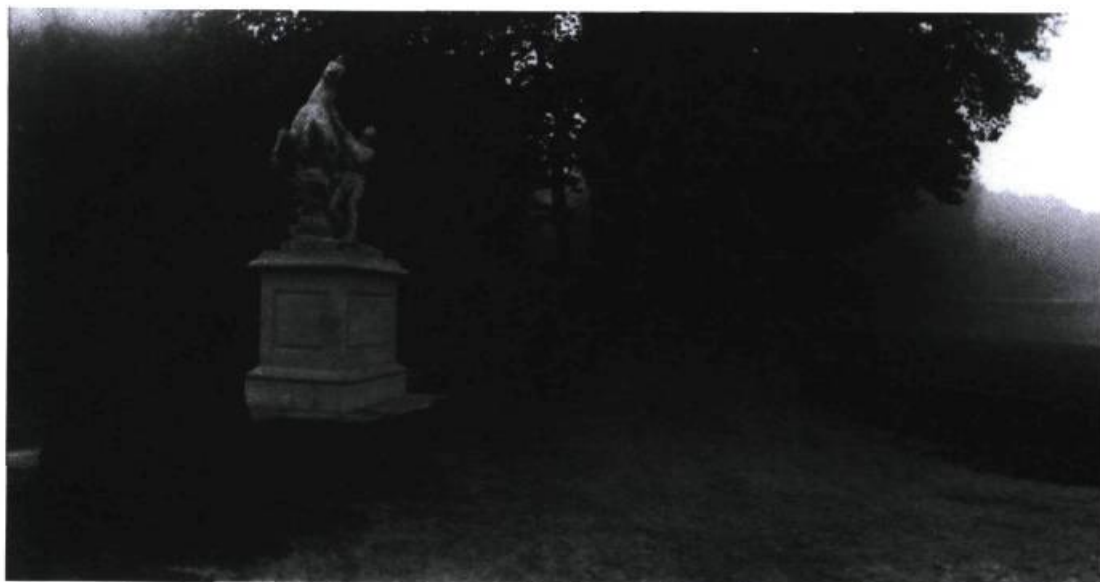
Geoffrey James, Marly, 1985. Épreuve argentique ; 9,5 cm x 27,3 cm. Galerie René Blouin.

Place Bonaventure, Montréal, du 13 au 17 novembre 1991