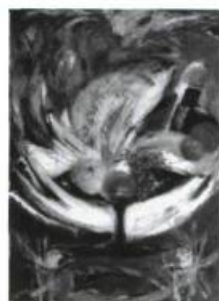
Élène Gamache, Nature morte aux anges et poisson , 1991, 76 cm x 108 cm.