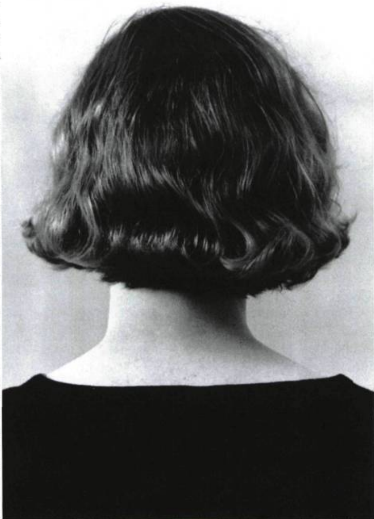
Jeanne Dunning, Head 9 , 1990. Cibachrome laminé sur plexiglass ; 72 cm x 48 cm.

paradoxe, que vient sans doute l'impression de malaise du spectateur. Dans cette même série, comme dans beaucoup de ses autres travaux, Jeanne Dunning parle du fragment et du rapport à l'image du corps, utilisant toute l'ambiguïté de l'élément isolé qui prend de ce fait une dimension emblématique de fétiche ou de totem. Passé le stade de la frustration du spectateur, privé de regard ; son approche de l'image pose la question de la relation du fragment au tout et de l'individu à une société de masse.