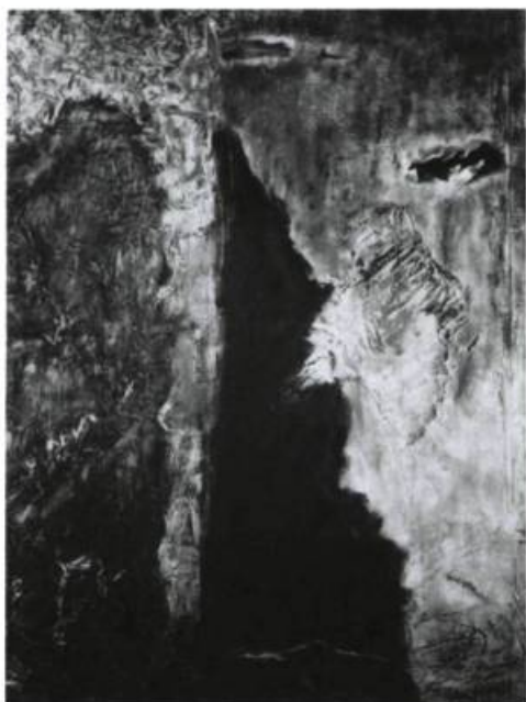
Christiane Cheyney, Continuum I , 1990. Techniques mixtes sur bois ; 170 cm x 122 cm.

Que pouvons-nous écrire au sujet de la collection de Maurice Forget dont l'exposition a suscité un concert unanime de louanges ? Presque tous les artistes importants de cette période sont présents. Dans la majorité des cas, les tableaux ou œuvres sur papier, généralement de petit format, sont d'une qualité et d'une fraîcheur qui ont perduré depuis toutes ces