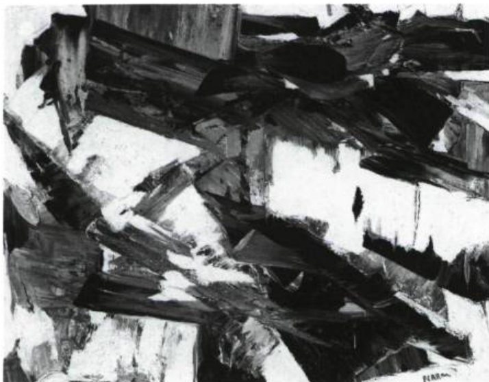
Marcelle Ferron, Sans titre , 1962. Huile sur toile ; 88 cm x 114 cm.