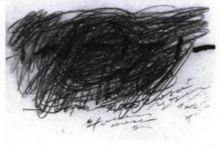
A. Tapiés, L'écriture , 1988. Gravure ; 35 cm x 50 cm. Galerie Simon Blais, Montréal.

récent séjour au Mexique, cherche à transposer en images le choc d'une culture qui est élaborée par la pensée magique et confrontée aux actuelles préoccupations écologiques.