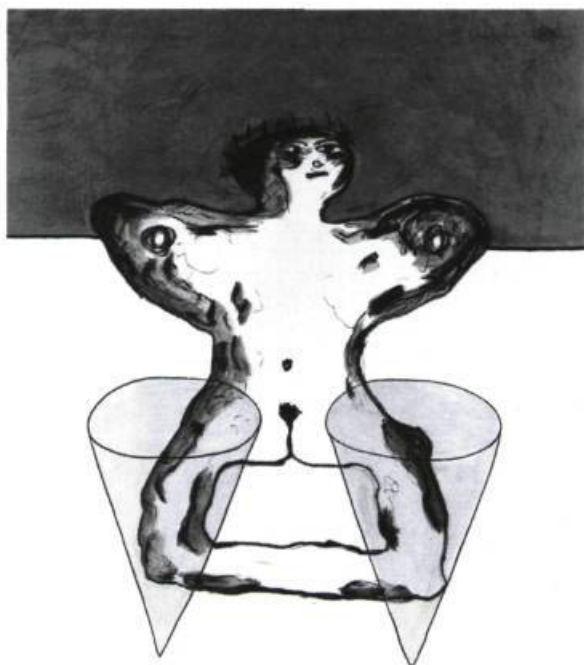
Franz Schwarzingler, Kommunizierend , 1989. Acrylique, encre et crayon ; 150 cm x 120 cm. Galerie Chobot, Vienne.

P OUR SA QUATRIÈME édition – si l'on fait abstraction des premières tentatives montréalaises du Salon des galeries d'art, à l'aube des années quatre-vingt – l'événement annuel Entrée libre à l'art contemporain (ELAAC) a été façonné par l'Association des galeries d'art contemporain de Montréal (AGACM) en tant que manifestation à la fois susceptible de générer l'« amour de l'art » chez les Montréalais – ou de le régénérer – tout en étant représentative de la diversité et de la