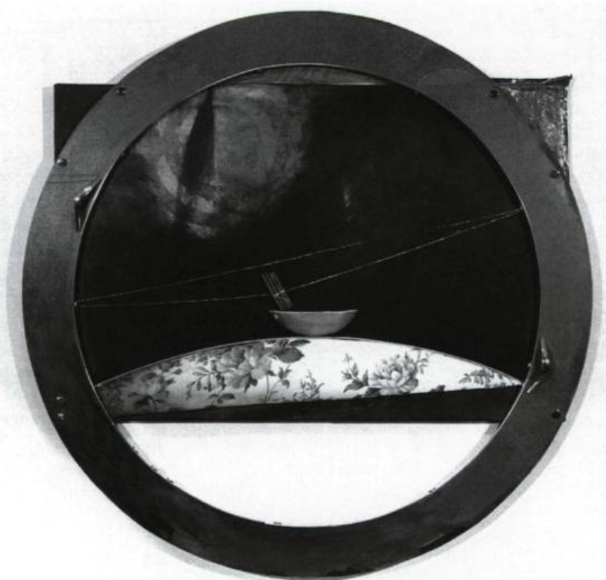
Danielle April, Paysage aux trois cailloux , 1990. Tissus, acrylique, bois, métal ; 102 cm x 102 cm. Galerie Estampe Plus, Québec.