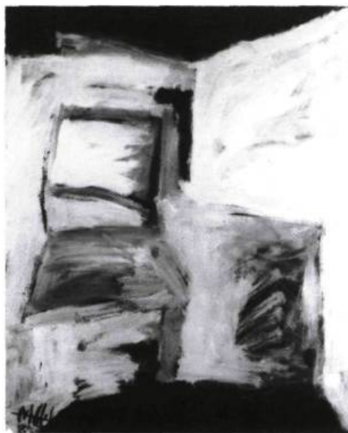
Michel Côté, La cuisine , 1985. Acrylique sur toile; 124,5 x 101,5 cm. Collection Pratt & Whitney