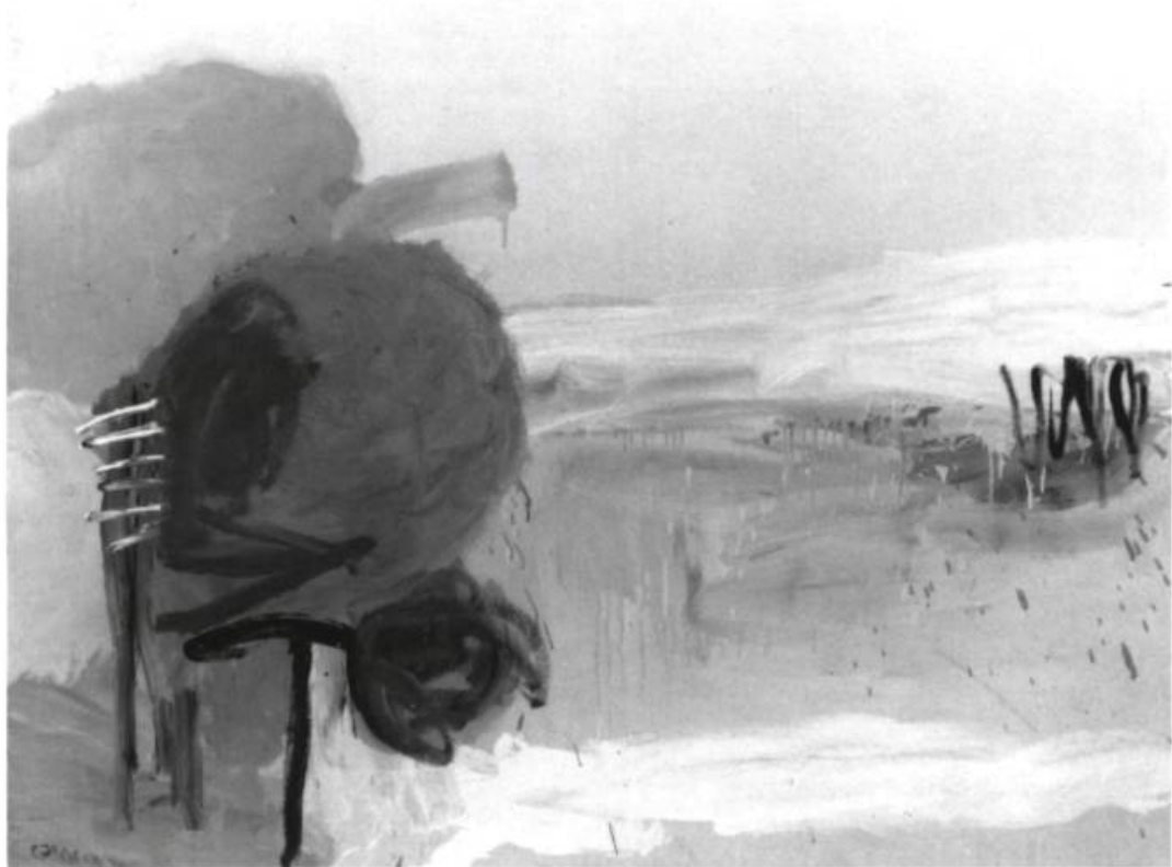
Charles Gagnon, Field , 1961. Huile sur toile; 96,6 x 121 cm. Collection et photo : Musée d'art contemporain de Montréal