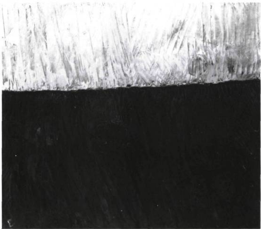
Paterson Ewen, Sans titre , 1963. Huile sur toile; 126 x 140,8 cm. Collection et photo : Musée d'art contemporain de Montréal