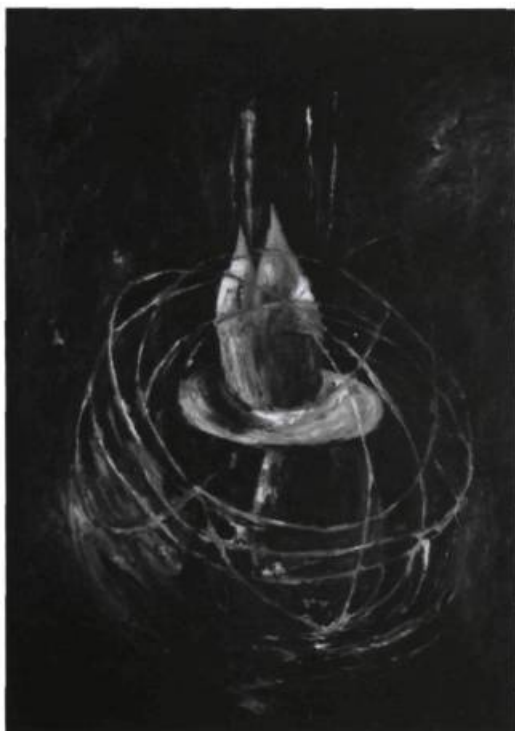
Ilana Isehayek, Sans titre , 1988. Huile sur papier; 244 x 172 cm.

D'autre part, le MAC avait eu l'heureuse idée