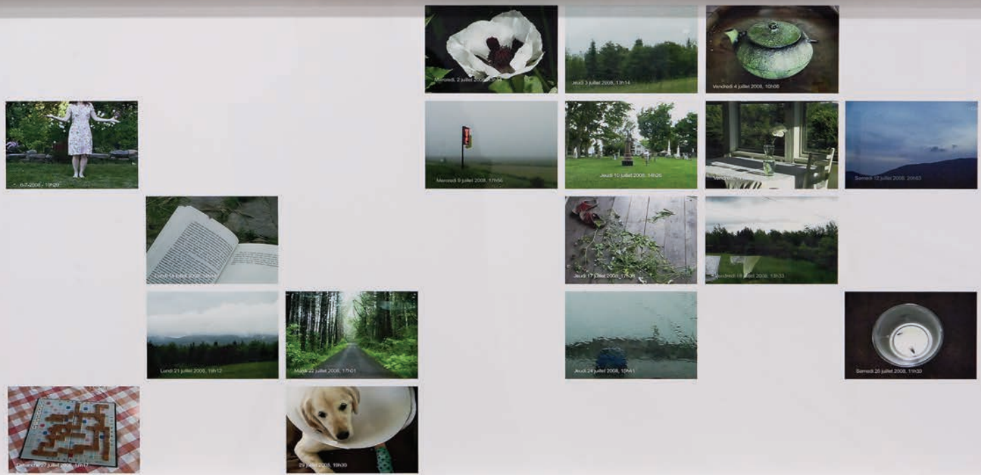
Claire Savoie, Aujourd'hui (dates-vidéos, calendrier) , 2006 -, installation photographique (détail), 68 épreuves numériques couleurs, images tirées de bandes vidéo.

mains, lits défaits, fleurs, animaux, neige, verres de vin, fenêtres, paysages urbains, campagnes verdoyantes : l'ensemble, chorégraphié avec subtilité et finesse, donne l'impression de pénétrer dans une mémoire volatile et fragmentée qui nous rappelle invariablement la nôtre et son évanescence. L'artiste ne raconte donc pas une histoire, encore moins la sienne, comme il serait aisé de le croire au premier abord; à travers le flot des images, c'est davantage au récit de nos propres souvenirs qu'elle nous convie. Dans la suite de nombreux autres, la pratique de Savoie s'inscrit à sa façon – et de belle façon, faut-il le préciser – dans le fantasme de ne pas