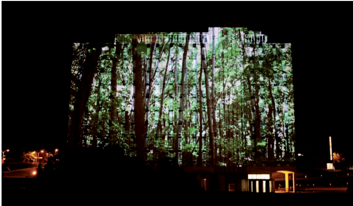
Nelly-Ève Rajotte (haut | top) Apex_01, 2013; (bas | bottom) Apex_02, 2013, vues d'installation | installation views, Espace (Im)média, Sporobole, Sherbrooke.