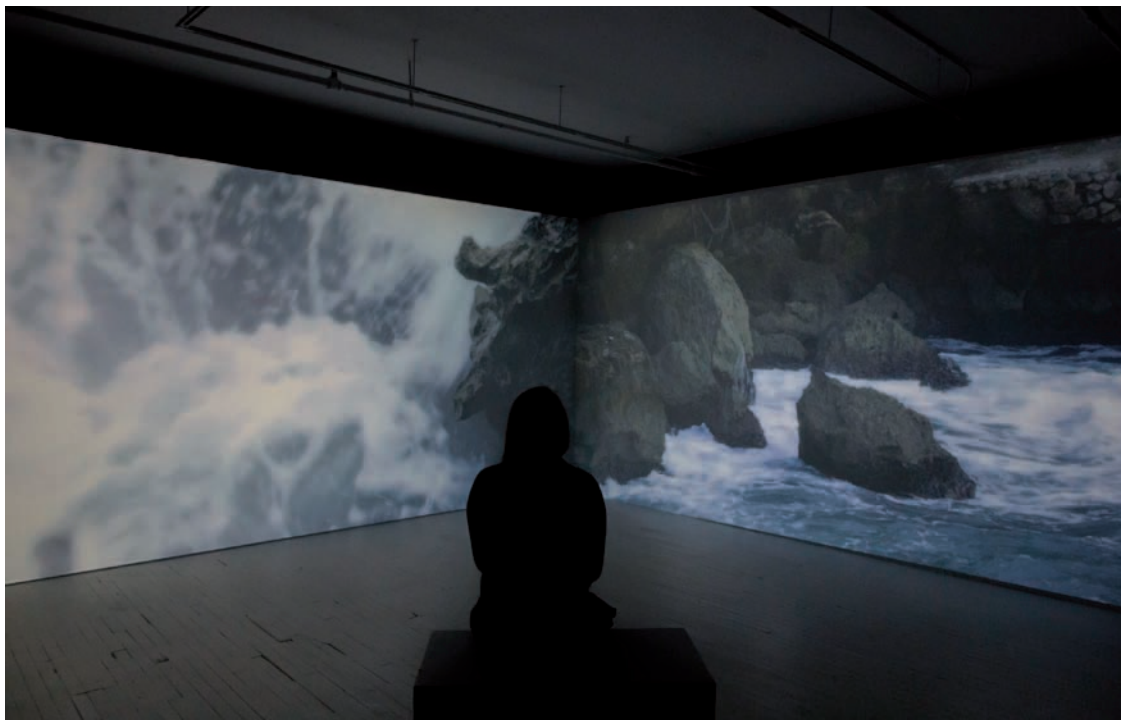
Nelly-Ève Rajotte Claustrophobie des grands espaces , 2016, vues d'installation | installation views, CIRCA art actuel, Montréal.