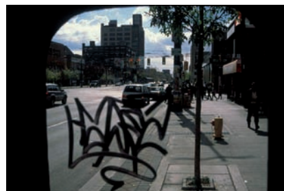
Adrian Blackwell, Circles Describing Spheres , 2014, vues d'installation | installation views, Cantor Fitzgerald Gallery, Haverford & OCAD University, Toronto.