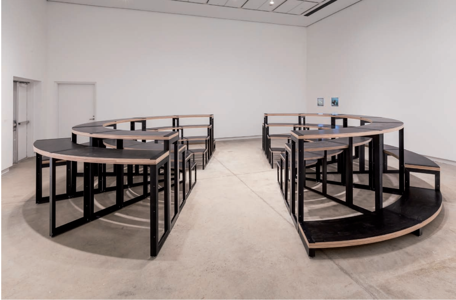
Adrian Blackwell, Furnishing Positions (Configuration 6) , 2014, vue d'installation | installation view, Blackwood Gallery, Mississauga.