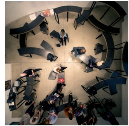
Adrian Blackwell, Furnishing Positions (Configurations 5, 2, 3) , 2014, vues d'installation | installation views, Blackwood Gallery, Mississauga.