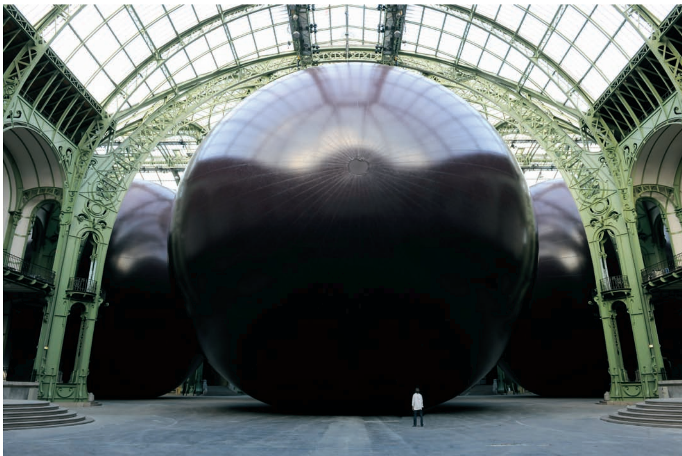
Anish KAPOOR, Leviathan , 2011. Vue extérieure.

Pourtant, la lumière semble venir de l'intérieur, tel le reflet d'un feu sur les parois d'une grotte, telle la lumière de la lampe torche de l'explorateur ou celle du fibroscope. On se demande où l'on est, dans quel espace intérieur. Certains imaginent un utérus. S'agissant d'un artiste indien, on peut aussi voir un parallèle avec les grottes d'Elephanta et comprendre les trois lobes comme les trois profils du dieu Shiva qui s'élèvent à 5,70 m au fond d'un espace carré 2 .