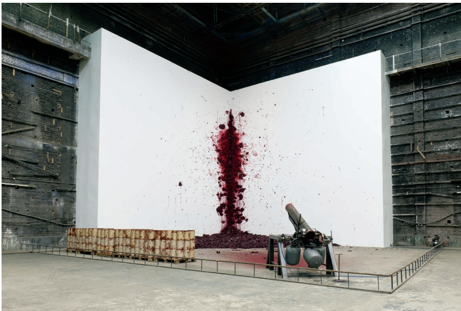
Anish KAPOOR, Shooting into the Corner, 2008-2009. Techniques mixtes. Dimensions variables. Vue de l'installation : Mehboob Studios, Mumbai. Avec l'aimable autorisation de la Gladstone Gallery, New York et Bruxelles.

La lumière différemment reflétée sur les surfaces contribue à troubler les frontières entre l'objet et l'espace où il se situe, dans une zone d'incertitude à l'intérieur de laquelle l'objet semble absorber son milieu en lui proposant une image reformulée de son environnement. Ce concept prend toute son ampleur avec S-Curve , une forme en S de deux mètres de hauteur et de plus de neuf mètres de long qui, à la fois, s'impose et se dissout au centre de l'espace. Pour le visiteur qui gravite autour de l'œuvre, les surfaces planes, concaves ou convexes révèlent une transformation tour à tour de la lumière et des images reflétées. Monumentale, la sculpture ne peut être saisie dans sa totalité. Le spectateur est alors amené à évaluer et à réfléchir l'espace qu'il occupe en tant qu'individu. Il se transforme en « acteur » puisqu'il devient, par la