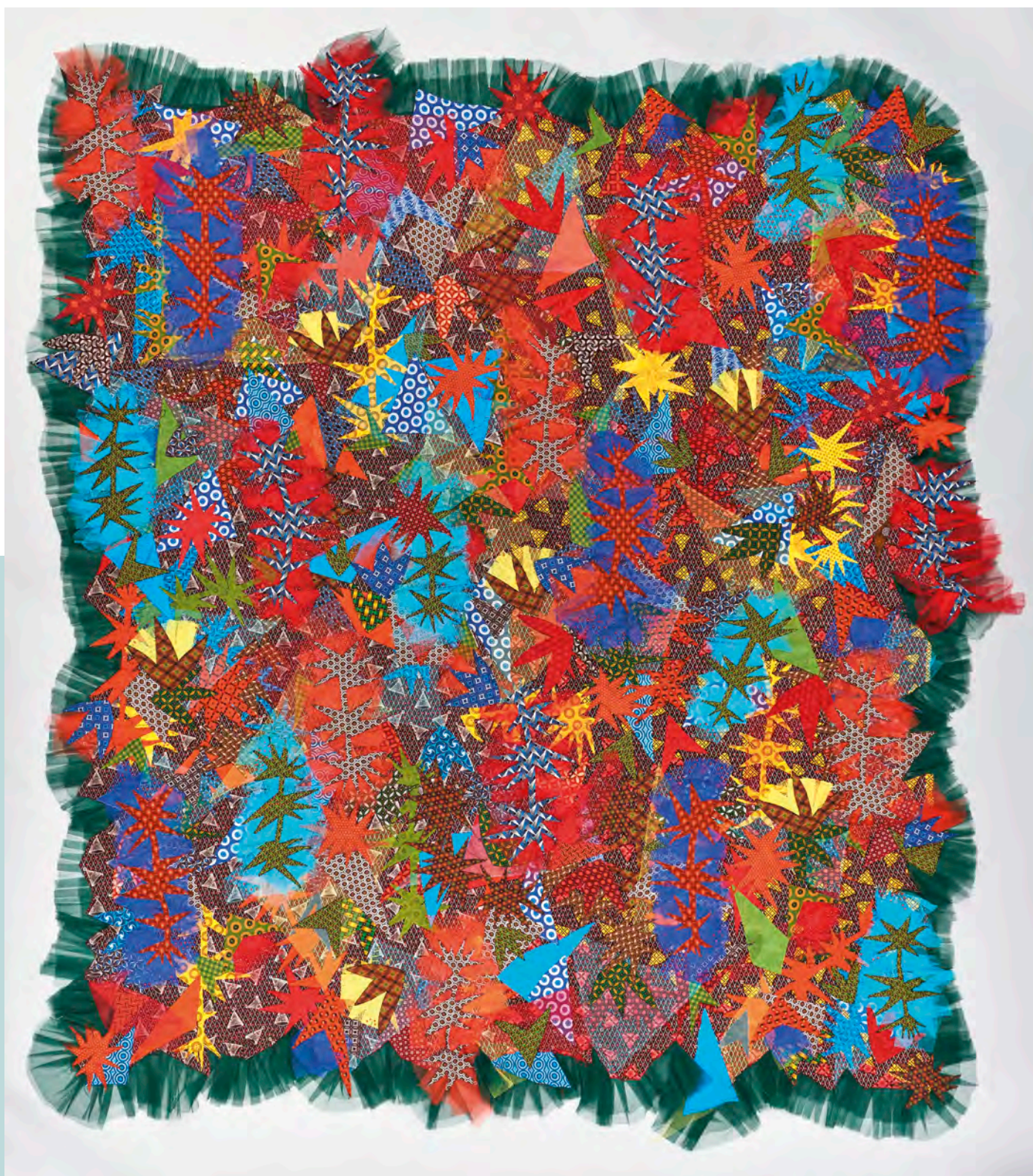
Siwa Mgoboza, L'ultrayon , 2017. Tissu isiShweshwe (Three Cats Cotton), perles de verre, tulle et fil de coton, 196 x 215 cm. © Siwa Mgoboza, avec l'aimable permission de la Matter Gallery. Photo : MBAC.