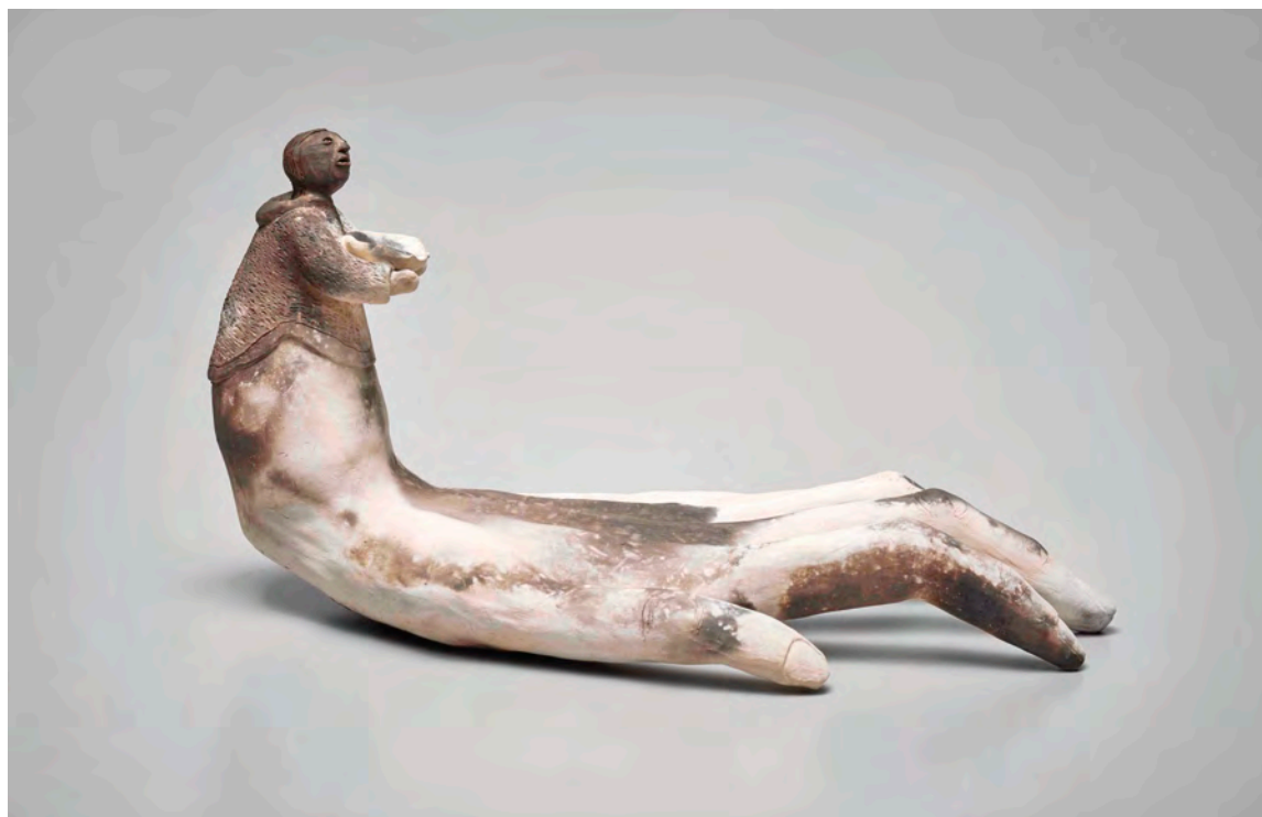
Pierre Aupilardjuk , Donner sans recevoir , 2016. Porcelaine et grès cuit en réduction, 23 x 45 x 22 cm. © Pierre Aupilardjuk.

Premiers Peuples, mais aussi leur capacité à répondre aux enjeux du présent et à proposer différentes projections pour le futur. L'activation, un des fils conducteurs les plus porteurs de l'exposition, met l'accent sur la capacité des œuvres à s'animer tant à travers la performance que par l'implication du visiteur dans l'expérience.