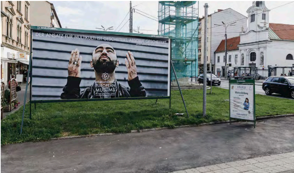
Public Movement, Rebranding European Muslims , Autriche, 2012. Commande du festival stierscher herbst, commissaire Florian Malzacher. Affiche : Luca Conte / Herz – information strategies.

fortement hétérogènes, rendant inopérantes les catégorisations attachées aux définitions traditionnelles de la performance ou de l'art engagé.