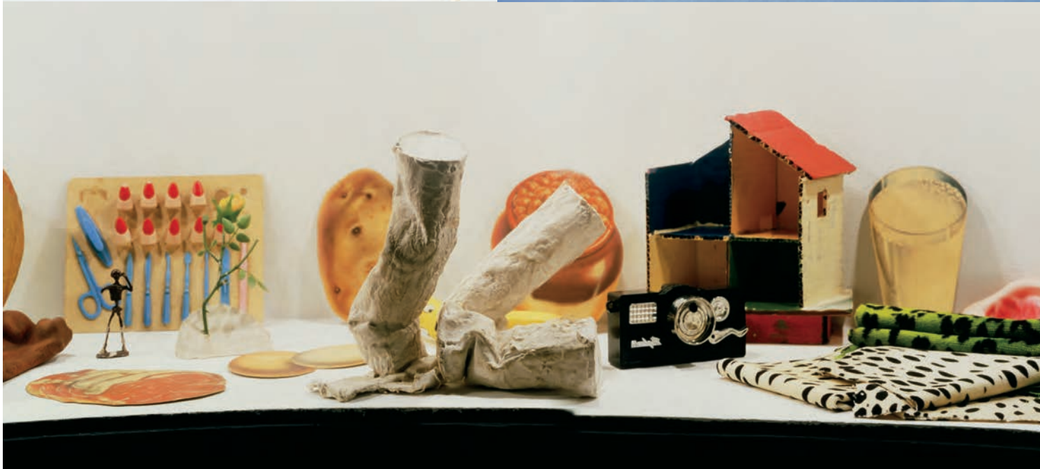
← ← Claes OLDENBURG , Mouse Museum , 1965-1977. Bois et aluminium ondulé, présentoirs en plexiglas avec 385 objets, son/Wood and corrugated aluminum, plexiglas display cases with 385 objects, sound. 2,6 x 9,5 x 1,0 m. Collection Museum Moderner Kunst, Stiftung Ludwig Vienna, Autriche/Austria. Prêté par/On loan from the Austrian Ludwig Foundation. Copyright 1965-1977 Claes Oldenburg.