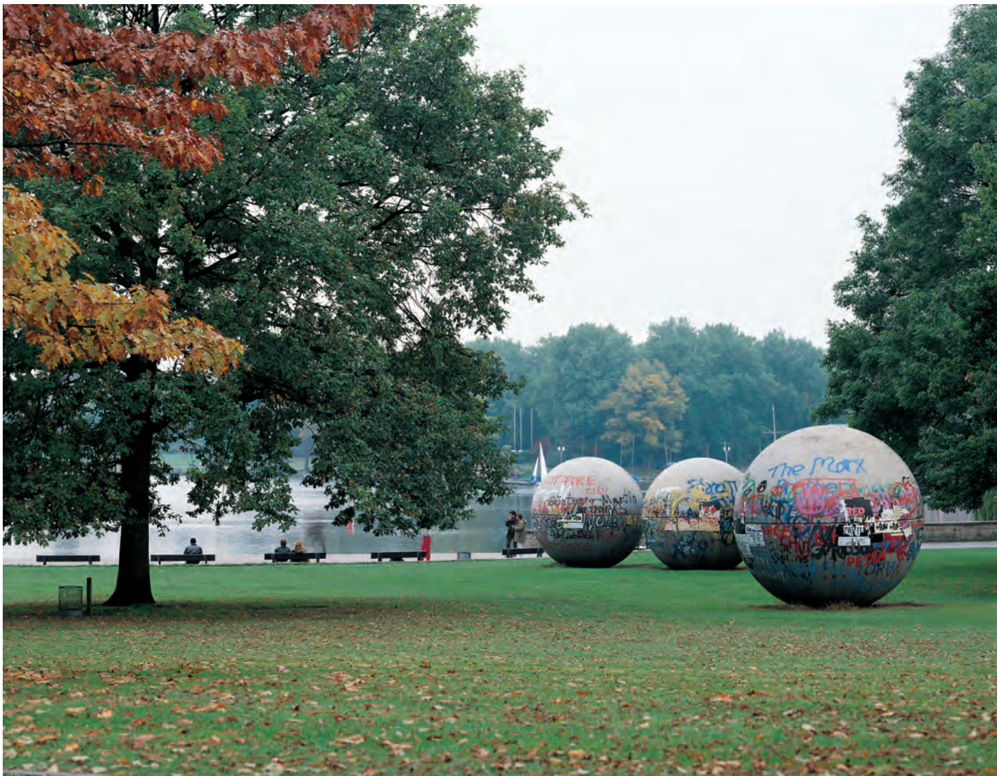
Claes OLDENBURG & Coosje VAN BRUGGEN, Pool Balls , 1977. Béton armé/Reinforced concrete. 3.5 m diam. ch/ea. Collection Aaseeterrassen, Münster, Germany. Copyright 1977 Claes Oldenburg and Coosje van Bruggen.