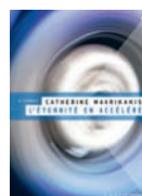
L'ÉTERNITÉ EN ACCÉLÉRÉ Héliotrope, 2010