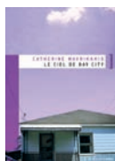
LE CIEL DE BAY CITY Héliotrope, 2009

Antigone, dans la pièce de Sophocle. Ce personnage tragique qui lutte contre le pouvoir au nom de ses convictions profondes, de son droit et de celui de son frère mort. Elle a le courage de se dresser contre l'ordre établi. Elle n'a pas peur de se sacrifier. J'aimerais bien qu'elle n'en meure pas. C'est vrai... Mais en attendant d'avoir des héroïnes victorieuses, c'est Antigone, la rebelle, l'insoumise, que j'admire.