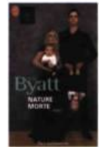
NATURE MORTE J'ai lu, 2000