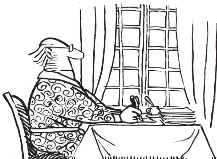
ILLUSTRATION : MORBURRE/WIKIPEDIA COMMONS

« C'est long, écrire. À moins d'être un Mozart de l'écriture, ça ne nous est pas donné d'un seul coup. » – Yvon Rivard