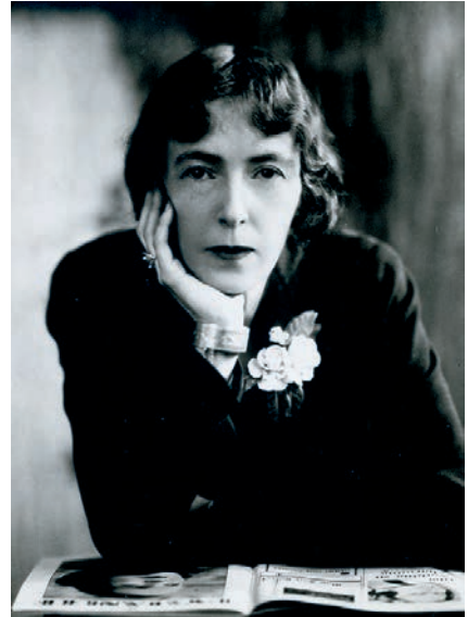
Mazo de la Roche.