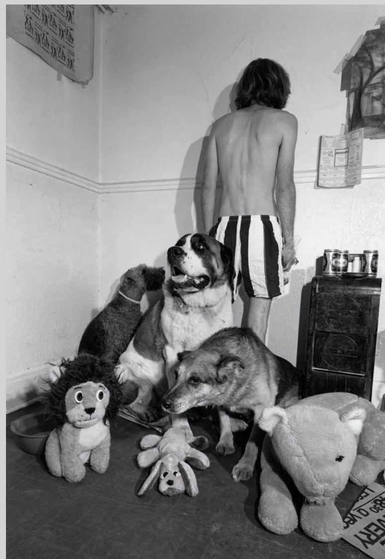
Donigan Cumming, The Stage (détail), 1990, installation, 250 épreuves argentiques, 22,7 x 15,2 cm ch.

Le regard cruel de Cumming délie le corps de la réalité pour le relier autrement, en déchire les membres pour les reconnecter en d'infinies variations, à la manière d'une sorte de « simulateur de réalité » qui aurait déraillé de son programme et produirait passionnément des mondes au hasard, pour les redéfaire aussitôt. En résultent de déconcertants petits tableaux qu'on pourrait qualifier d'anti-réalistes (mais qui ne sont pas pour autant surréels), et dont les effets déréalisants et dé-psychologisants ne sont pas sans rappeler ces insolites visions décrites par Descartes lorsque, en proie au doute absolu, les passants à sa fenêtre lui apparaissaient comme « des spectres ou des hommes feints qui ne se remuent que par ressorts 1 ». Ces photographies posent avec une intensité sans pareille la question même de l'humain, de la possibilité éthique : si rien n'est vrai ni réel, qui sont ces gens sur ces images? Où se trouve le noyau de leur être? Et de quoi peuvent-ils à ce point souffrir...?