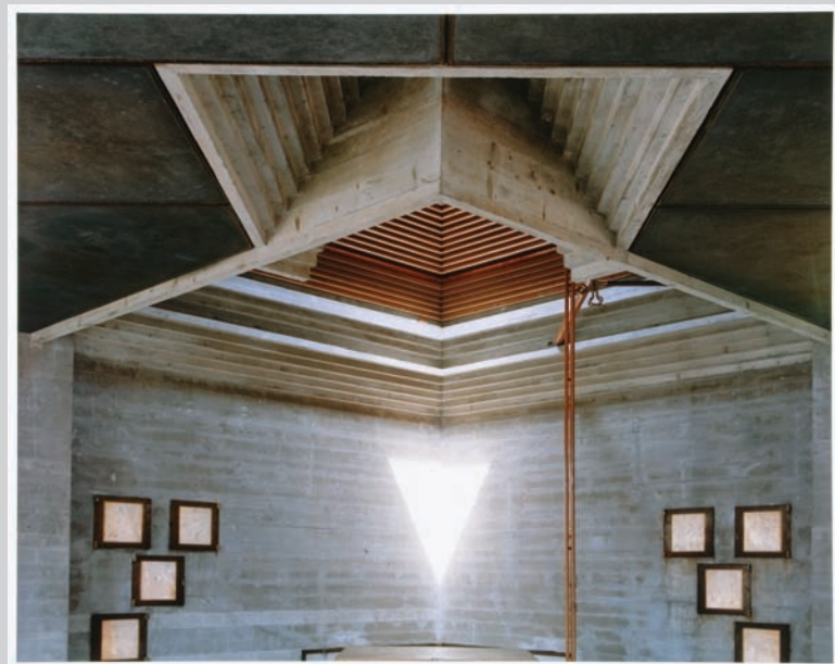
Guido Guidi, Brion's Family Tomba, San Vito d'Altivole: 12PM, Looking to the North , 2006, c-print, 60,8 x 76,4 cm, courtesy of the CCA.

James D. Campbell is a writer on art and independent curator based in Montreal. The author of over 100 books and catalogues on contemporary art and artists, he contributes frequently to visual arts publication across Canada.